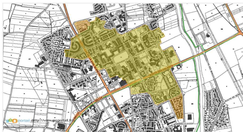
Val-de-Reuil « Centre-ville »