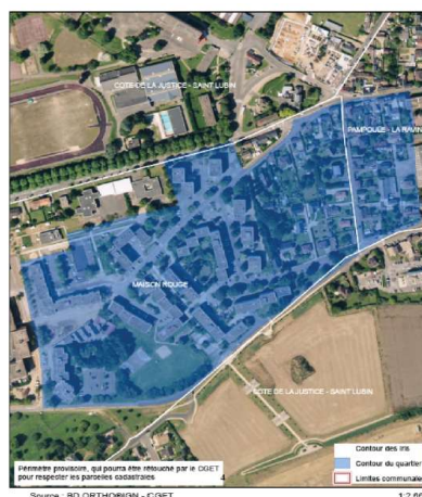
Louviers, Maison rouge