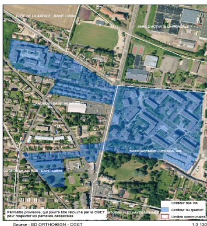
Louviers, les Acacias – la Londe – les Oiseaux

Les nouveaux territoires prioritaires sont :