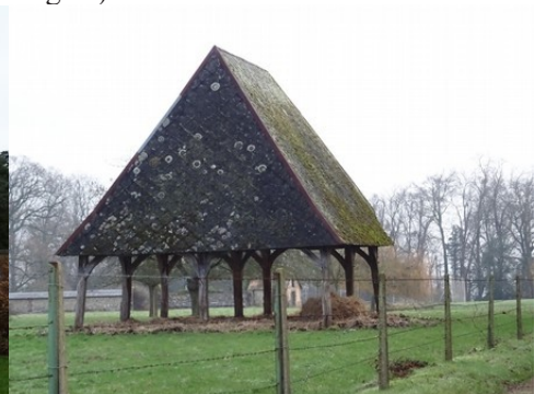
Château à Caumont Le manoir du Plouzel du XVII e siècle L'architecture rurale aux alentours