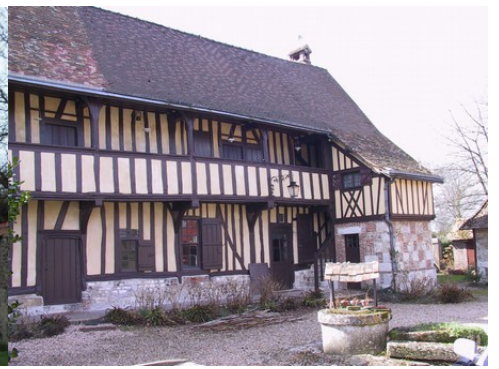
Le logis aligné sur la route (vue proche) Le logis depuis la route (vue éloignée) La façade du logis sur cour