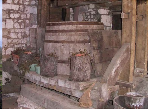
Les communs Le bâtiment des pressoirs Les vestiges des pressoirs

Pour la zone en rose foncé dans le périmètre de 500m