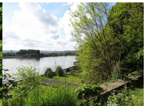
Une toiture en chaume La chapelle de la Ronce La vallée de la Seine située à proximité