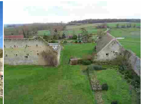
La vue côté Sud-Est de la tour seigneuriale