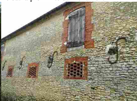
Le détail d'un mur en moellons