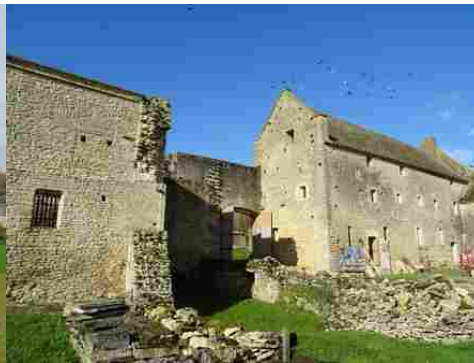
Une vue de la cour