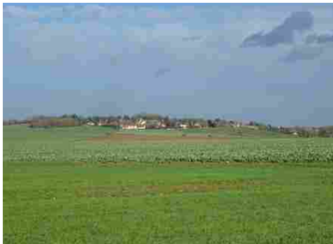
Une vue éloignée du village d'Authevernes

Les avis seront cohérents avec ceux émis ces dernières années, à savoir : pas de maisons à volume compliqué (type V, W, Y, ou Z), pentes à 45° pour les volumes principaux, ardoise ou tuile plate de teinte brun vieilli, à 20u/m 2 , avec un débord de toiture de 20cm, enduit de teinte beige clair avec modénatures (au choix : chaînages, encadrement de fenêtres, soubassement, colombage...). *Voir les autres fiches.