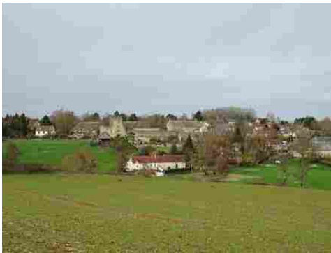
La maison forte vue du Sud