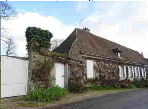
Le bâti à proximité du monument