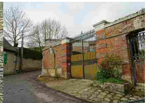
Un portail en briques