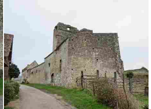
Le logis seigneurial vu du sud-ouest