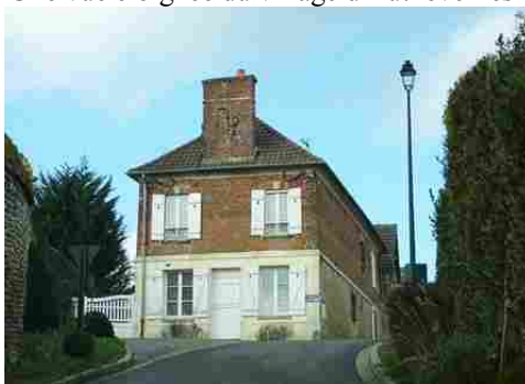
Une maison mêlant briques et moellons