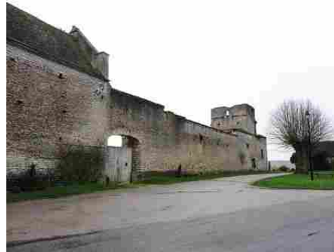
Une vue générale depuis la place