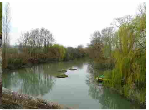
Le bras de la Seine en aval du moulin