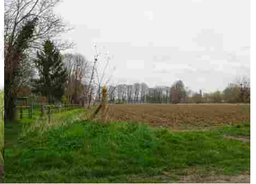
Les champs autour du moulin

Pour la zone en rose foncé dans le périmètre de 500m