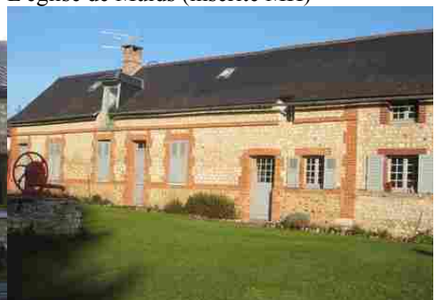
Un exemple d'architecture rurale