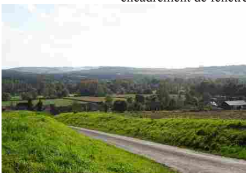
Le paysage de la vallée de la Seine

Les avis seront cohérents avec ceux émis ces dernières années, à savoir : pas de maisons à volume compliqué (type V, W, Y, ou Z), pentes à 45° pour les volumes principaux, ardoise ou tuile plate de teinte brun vieilli, à 20u/m², avec un débord de toiture de 20cm, enduit de teinte beige clair avec modénatures (au choix : chaînages, encadrement de fenêtres, soubassement, colombage...). *Voir les autres fiches.