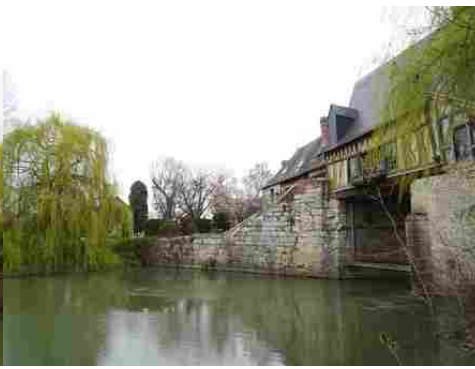
La vue vers la pile et la berge nord