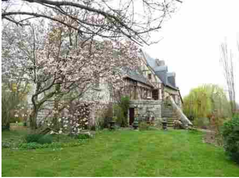
L'accès depuis la berge nord