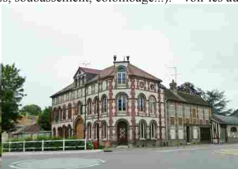
Une demeure dans le centre de Muids