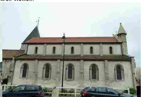
L'église de Muids (inscrite MH)