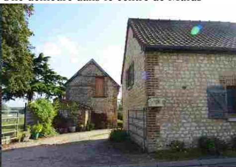
L'entrée d'une ancienne ferme