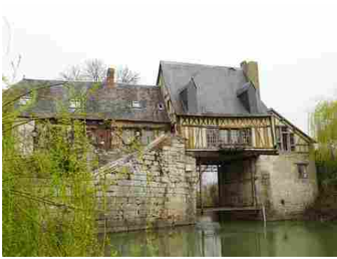
Le moulin enjambant en bras de la Seine