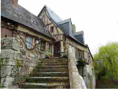
L'escalier d'accès sur la pile nord