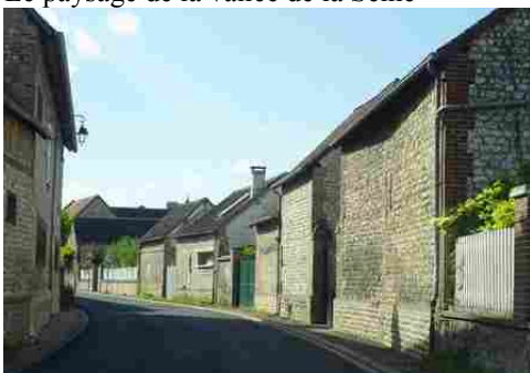
Le bâti associant moellons et briques