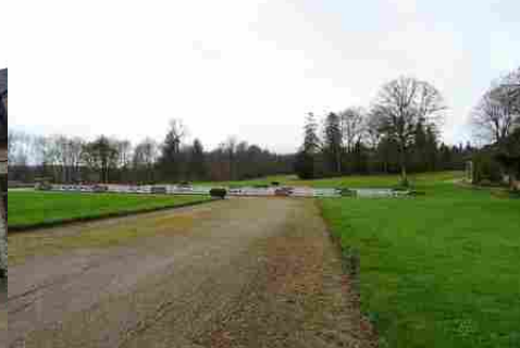
Le parc arboré