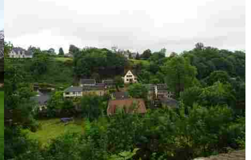
La vue depuis la galerie du château

Pour la zone en rose foncé dans le périmètre de 500m