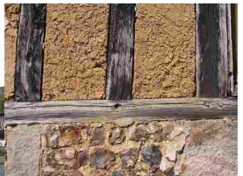
Différents matériaux (bauge, bois, silex)