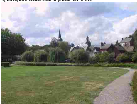
Le village depuis la Charentonne