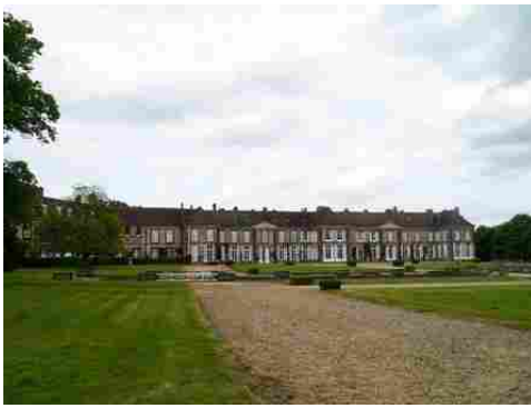
Le corps de logis (vue éloignée)