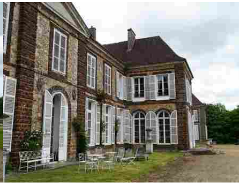
Le corps de logis (vues rapprochées)