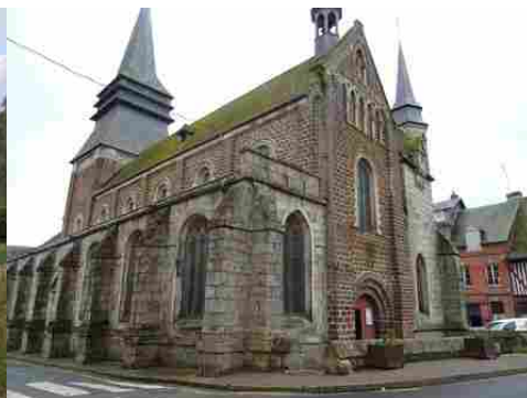
L'église de Broglie (classée MH)