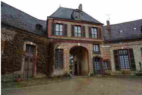
Le pavillon d'entrée