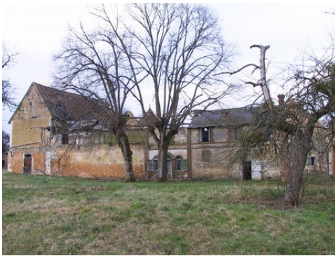
L'ancien enclos castral