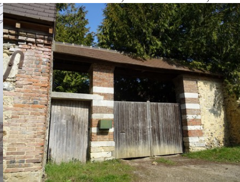
Un portail couvert