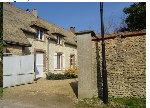
Moellons, briques et tuiles plates