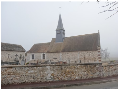
L'église du Plessis-Hébert

Les avis seront cohérents avec ceux émis ces dernières années, à savoir : pas de maisons à volume compliqué (type V, W, Y, ou Z), pentes à 45° pour les volumes principaux, ardoise ou tuile plate de teinte brun vieilli, à 20u/m 2 , avec un débord de toiture de 20cm, enduit de teinte beige clair avec modénatures (au choix : chaînages, encadrement de fenêtres, soubassement, colombage...). *Voir les autres fiches.