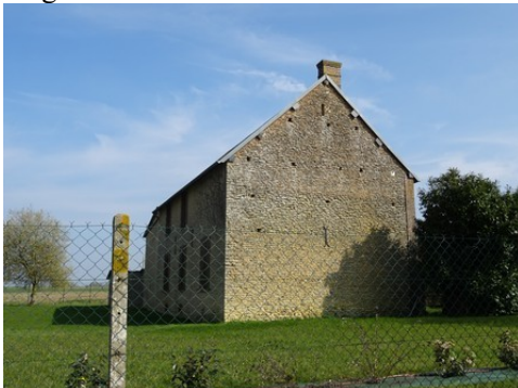
Le pignon d'un ancien corps de logis