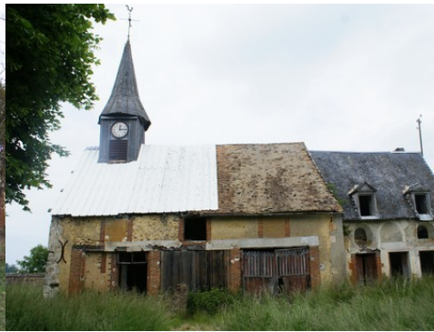
Les vestiges de l'église