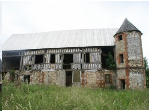
L'ancien manoir XV e -XVI e