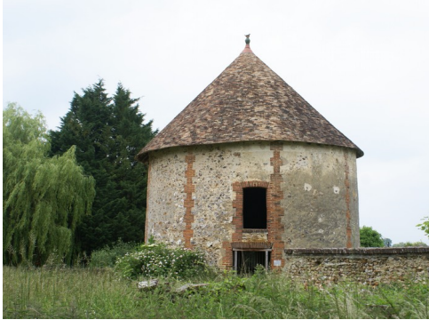
Le colombier circulaire