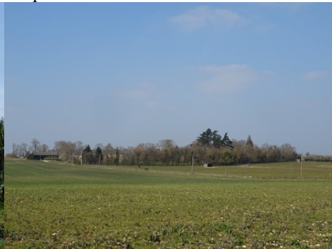
Le paysage rural alentour