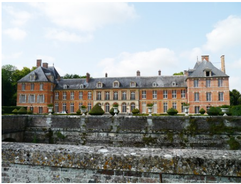
Le château vu du Sud