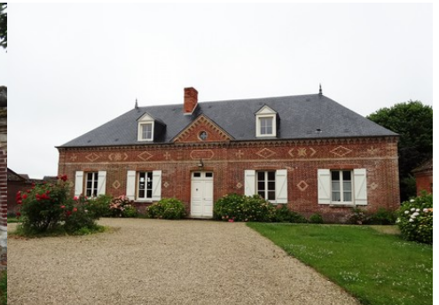
L'école du village