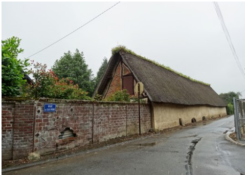
Une maison aux abords