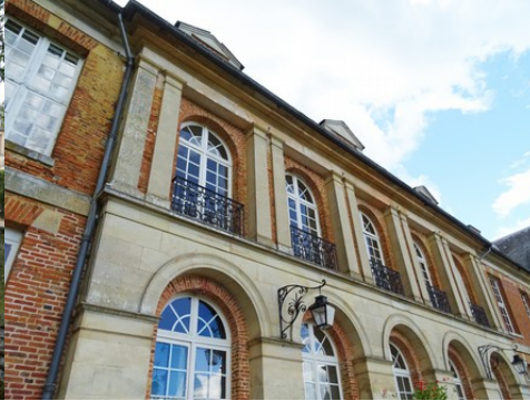
L'avant-corps en pierre (détail)