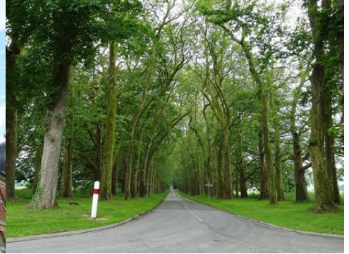
La perspective vers le Sud

Pour la zone en rose foncé dans le périmètre de 500m