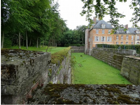
Les fossés (côté ouest)