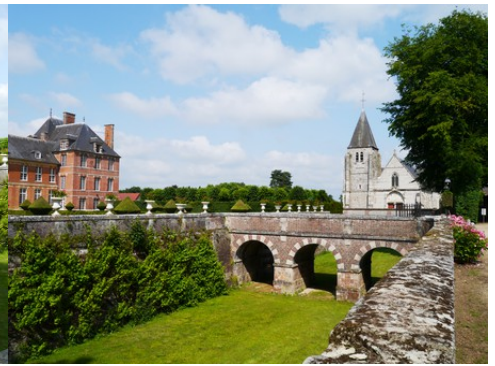
La vue vers l'église et le château