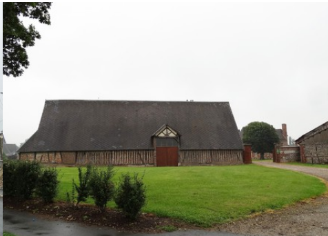
Des exemples d'architecture rurale