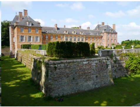
La château vu du Sud-Ouest