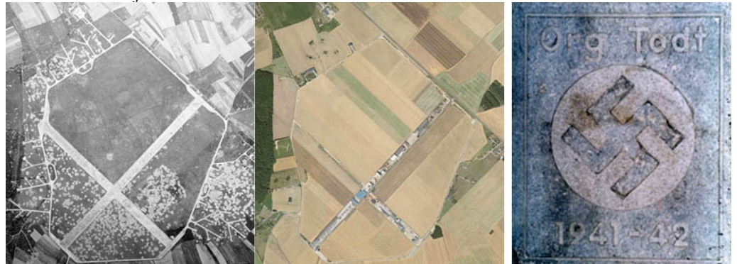
Une plaque a également été signalée par la DGAC à l'intersection des deux pistes.

Conches en Ouche (voir fiche Les Essentiels Connaissance n°53). La comparaison entre 1947 et aujourd'hui est intéressante.