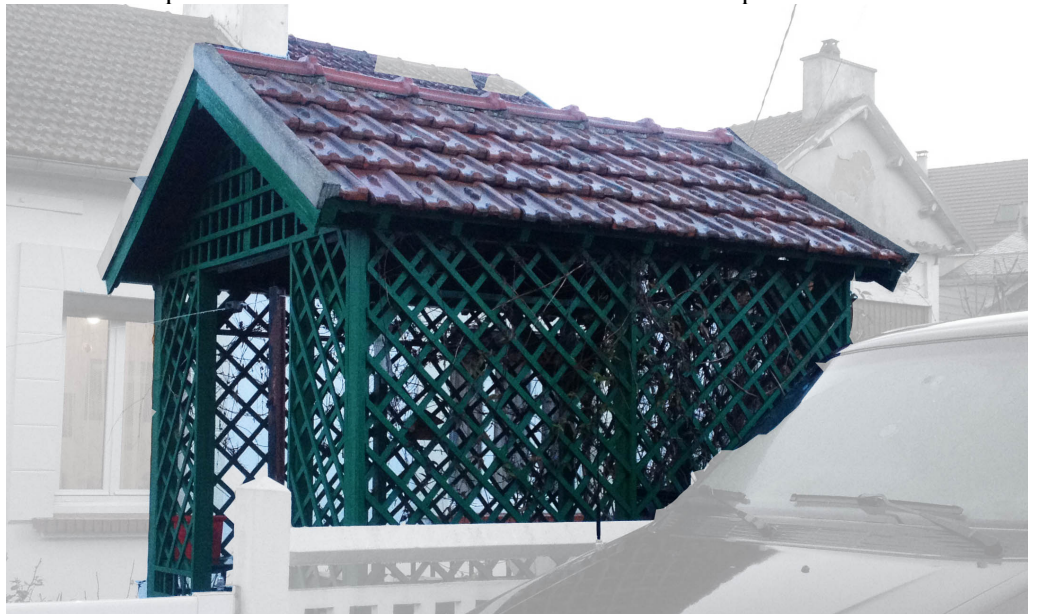
* vue indicative, à voir pour un modèle personnalisé

Au Petit-Andely, le passage de la Vélo-Route Voie Verte va conduire à paysager l'espace des quais qui n'avaient pas connu d'aménagements depuis l'après-guerre. Or, ce projet ne va pas conduire à régler les autres projets qui doivent émerger sur le site ou qui sont déjà présents avec notamment les aménagements liés aux bateaux de croisière et à la valorisation de Château-Gaillard. Il est nécessaire de conserver un caractère romantique à cet espace de quai qui a connu moult expressions artistiques (tableaux, gravures...) et qui permet, depuis des décennies, tant aux habitants qu'aux touristes d'avoir un rapport privilégié avec la Seine, mais aussi avec l'histoire de la Normandie. La réalisation d'édicules en croisillons bois peints en vert anglais peut donner ces aspects et dissimuler toutes les installations techniques.