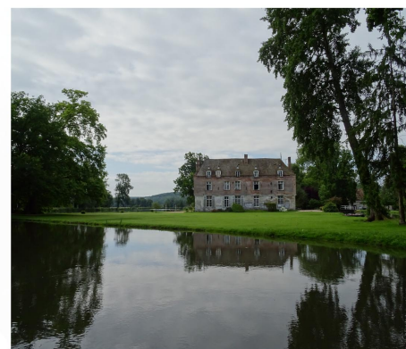
Heudreville sur Eure : Château

Il faut veiller, pour ces monuments historiques, à ce que les vannages soient préservés et ce, même s'ils se trouvent à distance par rapport au monument. Il en est ainsi pour les jardins de Claude Monet qui voient leur gestion « hydraulique » gérée en partie par la région voisine, et donc les services de l'Etat du département et de la région de l'Île de France. Cela nécessite donc une bonne coordination en amont de l'ensemble des services.