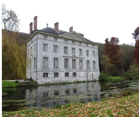
Amfreville sur Iton : Château