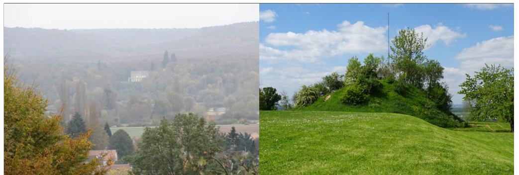
Château de la Madeleine à Pressagny L'Orgueilleux (vue depuis le château de Saint Just).

Seules les mottes féodales de Venables et Port-Mort, tout comme Château Gaillard, ne furent pas réutilisées. Pour Venables, sans doute en raison de sa très petite taille, pour Port-Mort de par la faible possibilité d'implanter un château avec des terrasses et pour Château Gaillard sans doute du fait de son caractère symbolique de fin du duché Normand.