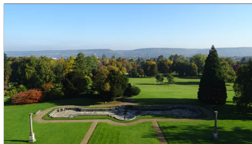
Château de Bizy à Vernon

Le château de Bizy à Vernon, de Saint-Just, le domaine Renault à Herqueville tout comme les châteaux de Port-Mort, de Tosny,... ont été construits sur des sites quasi vierges, à l'exception parfois de présence de relais de chasse ou de petits manoirs dont les traces ne sont plus visibles.