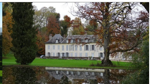
Château de Saint Just