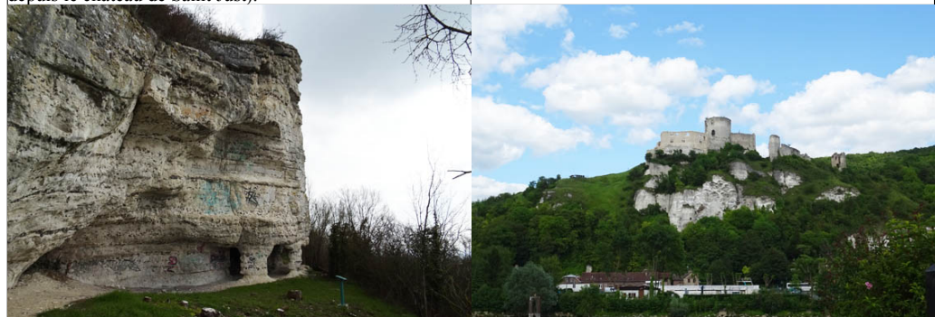
Motte féodale de Port-Mort