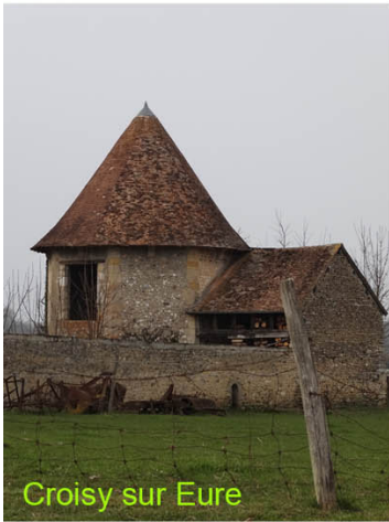
Croisy sur Eure