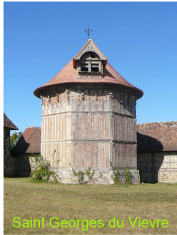
Saint Georges du Vievre