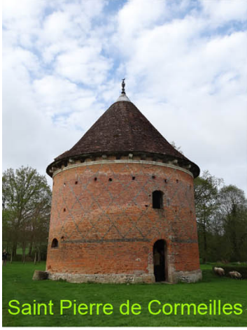
Saint Pierre de Corneilles