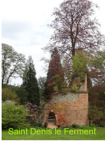
Saint Denis le Ferment