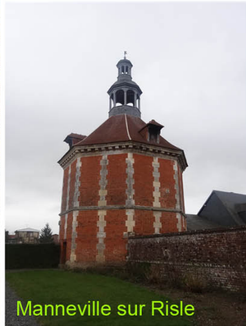
Manneville sur Risle