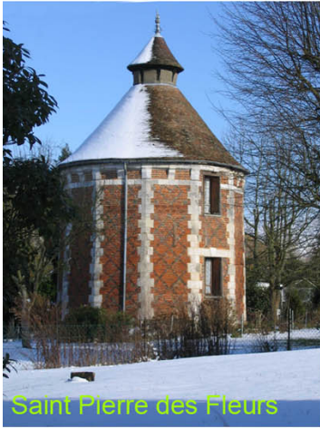
Saint Pierre des Fleurs