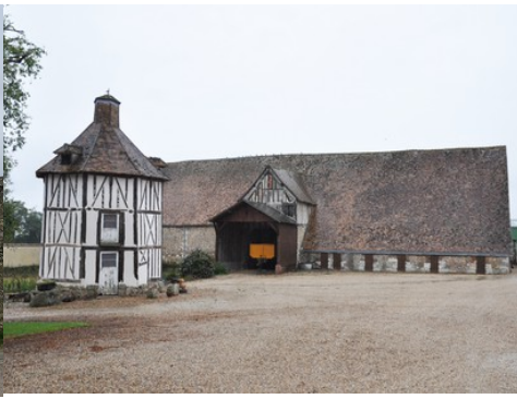
Le colombier et la grange