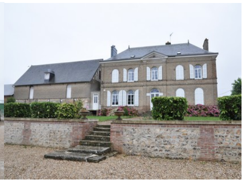
Le logis reconstruit au XIX e siècle