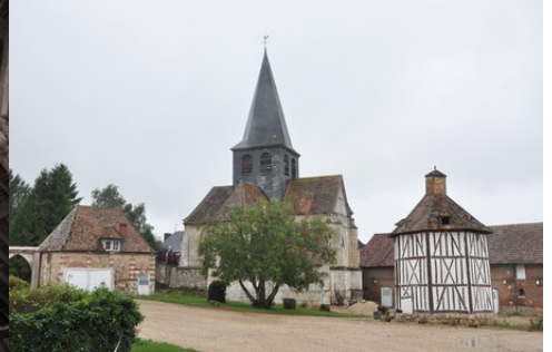
L'église et le colombier vus de la cour

Il est préférable d'éviter les constructions qui viendraient au-dessus de la ligne de paysage existante (maison à deux niveaux, bâtiments agricoles de type silo, château d'eau, éolienne...). Les projets éoliens ne doivent pas se trouver dans l'axe majeur du château à moins de nuire irrémédiablement à son caractère.