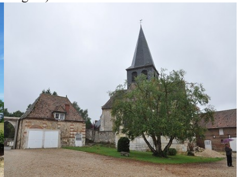
Église vue depuis la cour