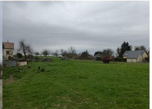
Champs au sein de la commune