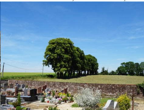
Les champs vus du cimetière