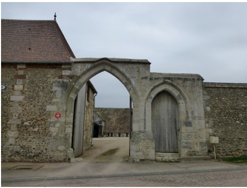
Le portail d'entrée et ses arcades brisées