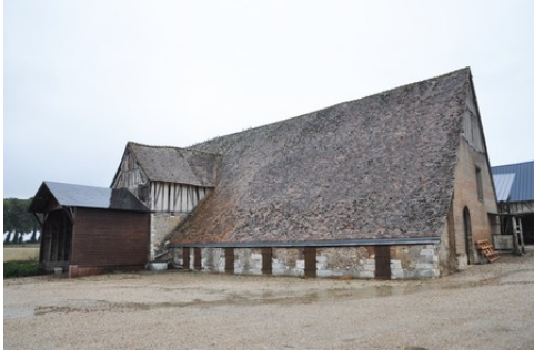
La grange dîmière Pour la zone en rose foncé dans le périmètre de 500m