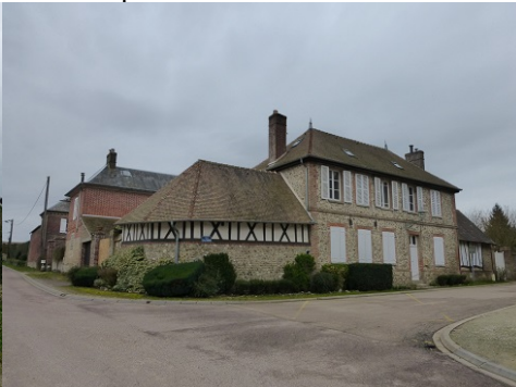
Les abords du monument