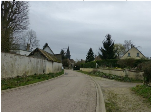
Rue de Guiseniers