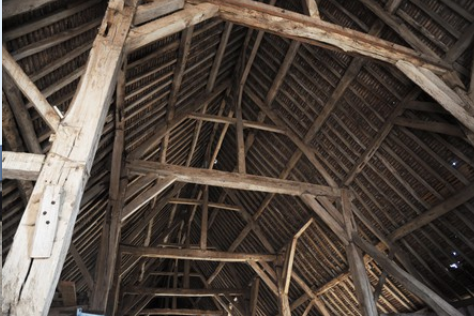
La charpente de la grange