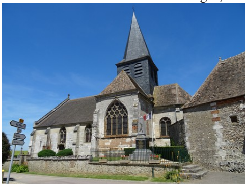
L'église de Guiseniers (inscrite MH)

Les avis seront cohérents avec ceux émis ces dernières années, à savoir : pas de maisons à volume compliqué (type V, W, Y, ou Z), pentes à 45° pour les volumes principaux, ardoise ou tuile plate de teinte brun vieilli, à 20u/m 2 , avec un débord de toiture de 20cm, enduit de teinte beige clair avec modénatures (au choix : chaînages, encadrement de fenêtres, soubassement, colombage...). *Voir les autres fiches.