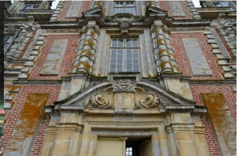
Le détail du fronton d'entrée