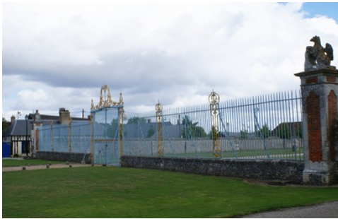
La grille d'entrée du château