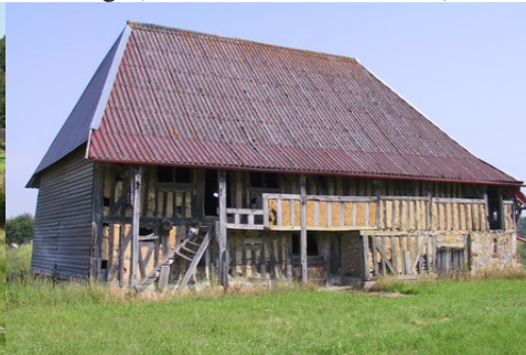
Quelques exemples d'architecture rurale