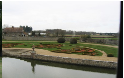
Les jardins avec parterres