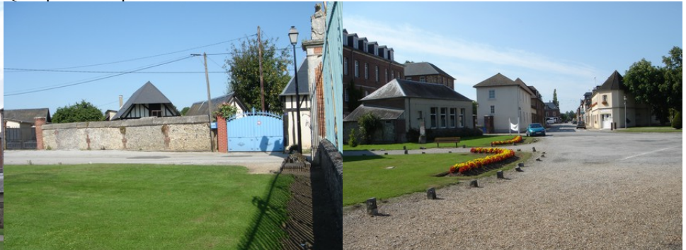
Le cadre bâti autour de la perspective