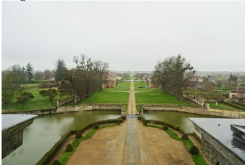
La perspective ouest (côté village)