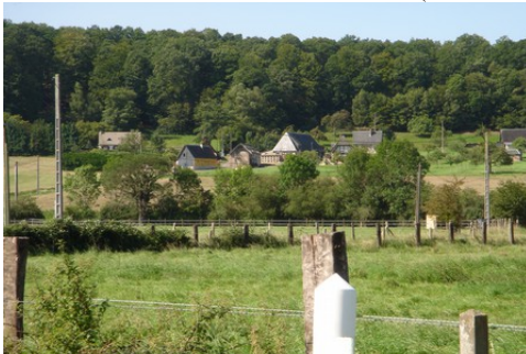
Les champs et les bois autour du village

Les avis seront cohérents avec ceux émis ces dernières années, à savoir : pas de maisons à volume compliqué (type V, W, Y, ou Z), Rez-de-chaussée + Combles, pentes à 45° pour les volumes principaux, ardoise ou tuile plate de teinte brun vieilli, à 20u/m², avec un débord de toiture de 20cm, enduit de teinte beige clair avec modénatures (au choix : chaînages, encadrement de fenêtres, soubassement, colombage...). *Voir autres fiches.