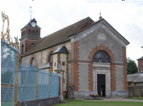
L'église de Beaumesnil