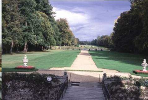
La perspective est (côté parc)