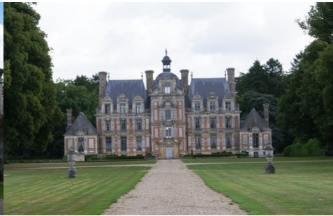
La façade ouest du château