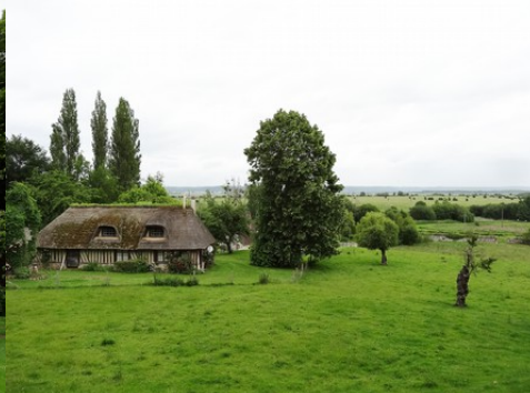
La campagne environnante