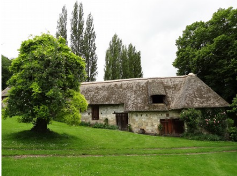
L'association de la pierre et de la chaume