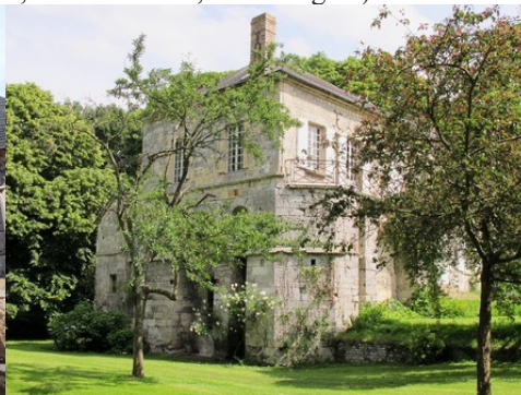
L'ancienne abbaye de Grestain (inscrite)