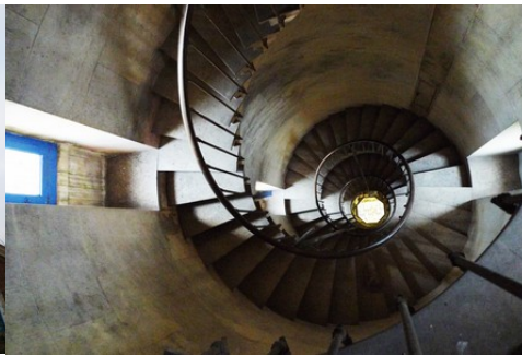
L'escalier circulaire de la tour