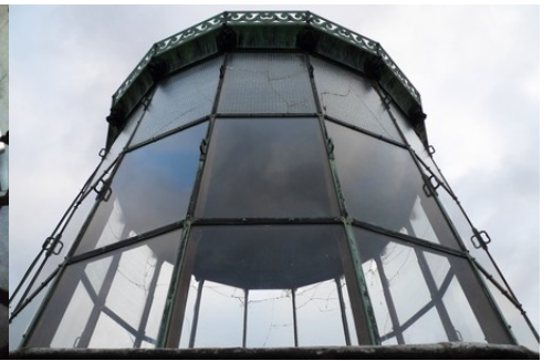
La verrière à structure en fonte et laitton