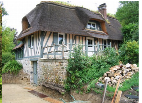
Le bâti à pans de bois et toiture en chaume