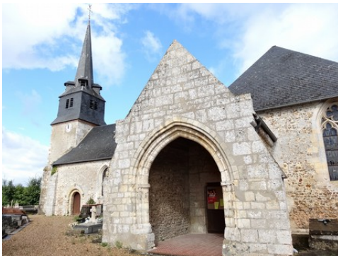
L'église de Fatouville-Grestain (inscrite)

Les avis seront cohérents avec ceux émis ces dernières années, à savoir : pas de maisons à volume compliqué (type V, W, Y, ou Z), pentes à 45° pour les volumes principaux, ardoise ou tuile plate de teinte brun vieilli, à 20u/m 2 , avec un débord de toiture de 20cm, enduit de teinte beige clair avec modénatures (au choix : chaînages, encadrement de fenêtres, soubassement, colombage...). *Voir les autres fiches.