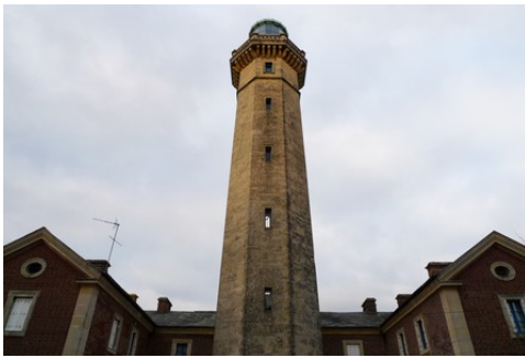
La tour octogonale du phare