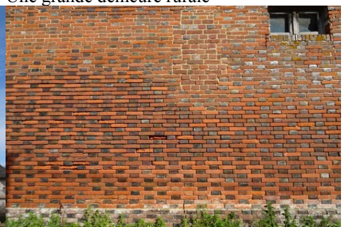
Un mur en briques polychromes (détail)