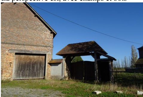
L'entrée d'une ferme