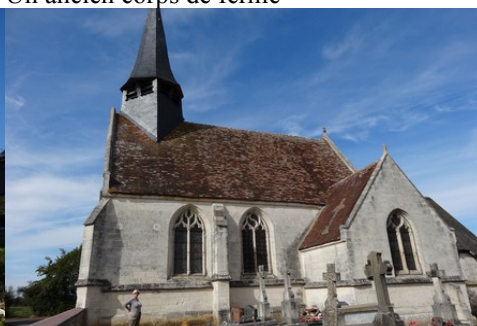
L'église de Barquet