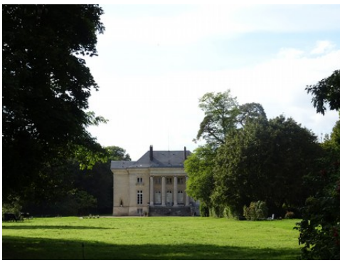
La façade est du château