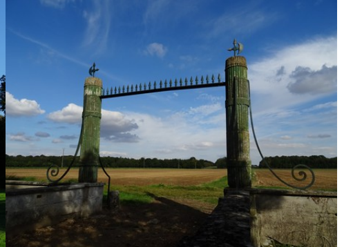
La portail à faisceaux et francisques

Pour la zone en rose foncé dans le périmètre de 500m