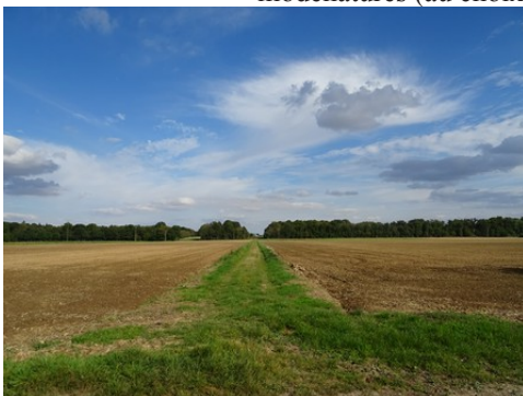
La perspective est, avec champs et bois

Les avis seront cohérents avec ceux émis ces dernières années, à savoir : pas de maisons à volume compliqué (type V, W, Y, ou Z), Rez-de-chaussée + Combles, pentes à 45° pour les volumes principaux, ardoise ou tuile plate de teinte brun vieilli, à 20u/m 2 , avec un débord de toiture de 20cm, enduit de teinte beige clair avec modénatures (au choix : chaînages, encadrement de fenêtres, soubassement, colombage...). *Voir autres fiches.