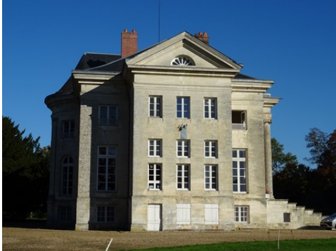
La façade sud