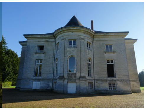
La façade ouest du château