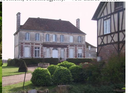
Une grande demeure rurale