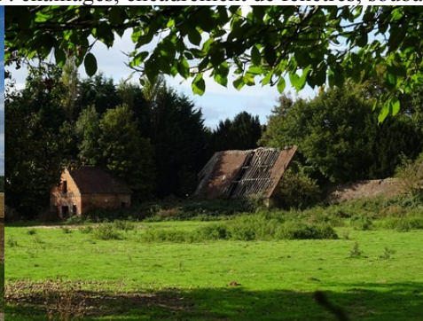
Un ancien corps de ferme