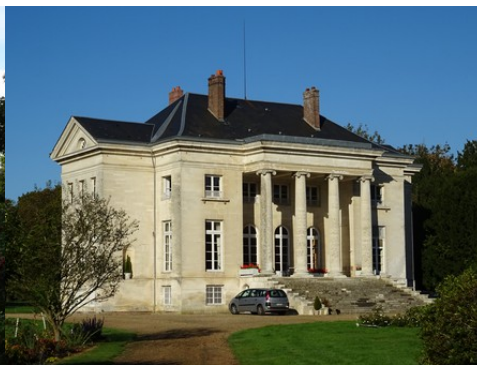
La façade est (vue rapprochée)