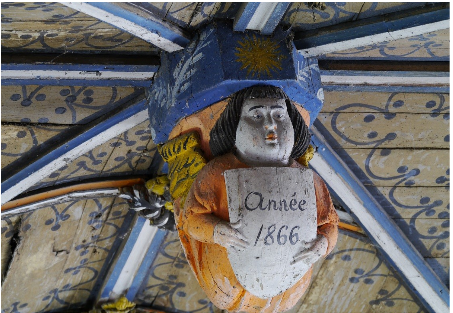
Photographie du monument historique