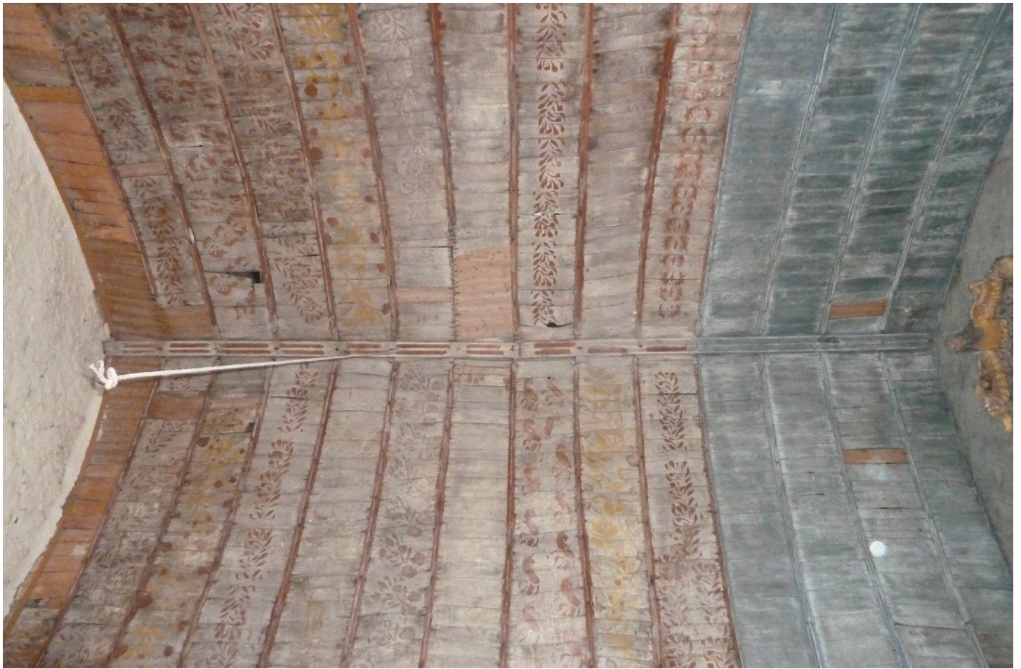
Photographie du monument historique