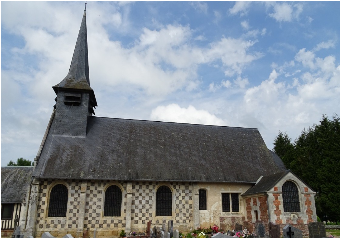
Photographie du monument historique