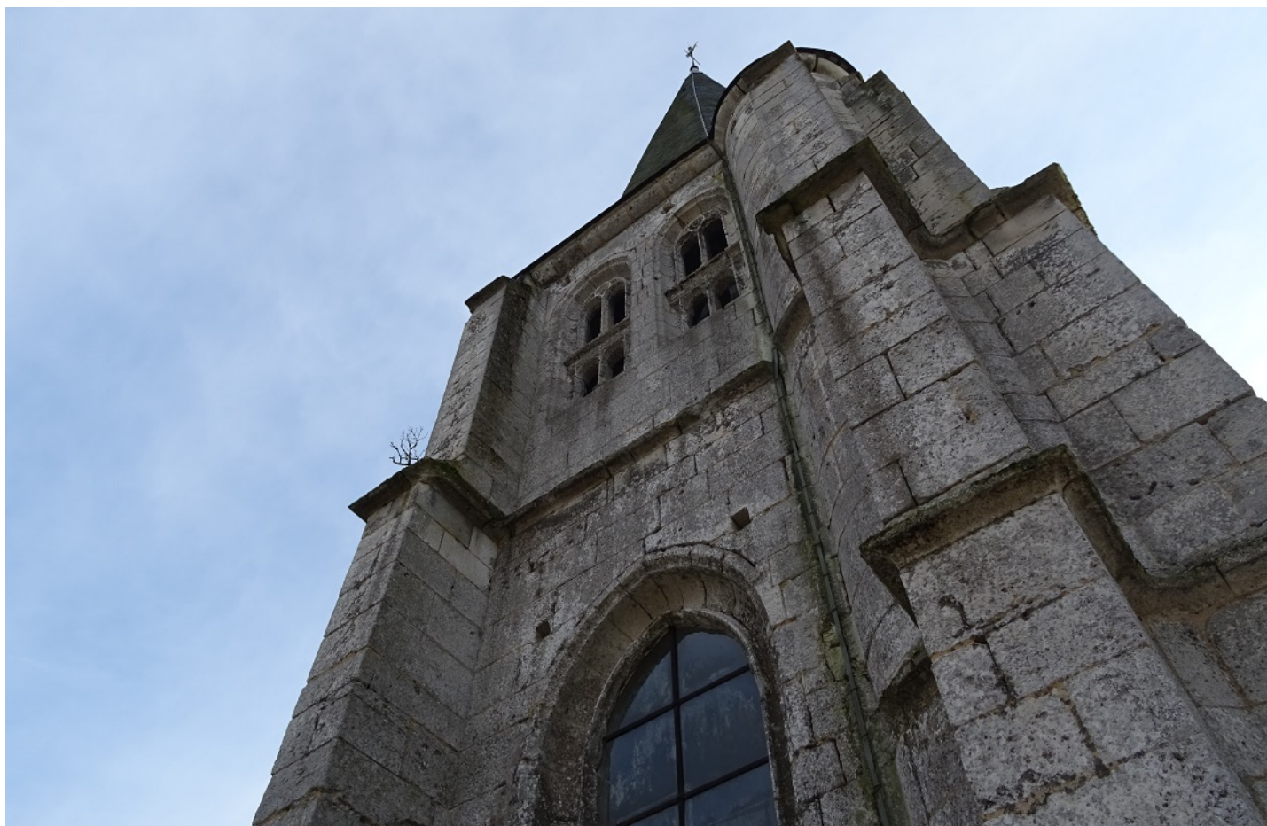
Photographie du monument historique