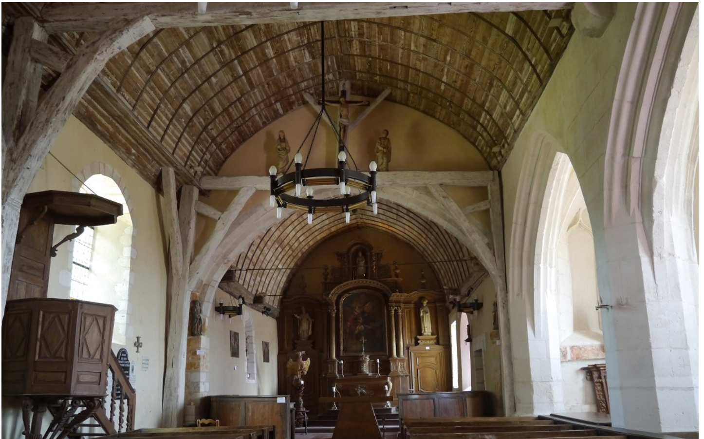
Photographie du monument historique nd de Canelon