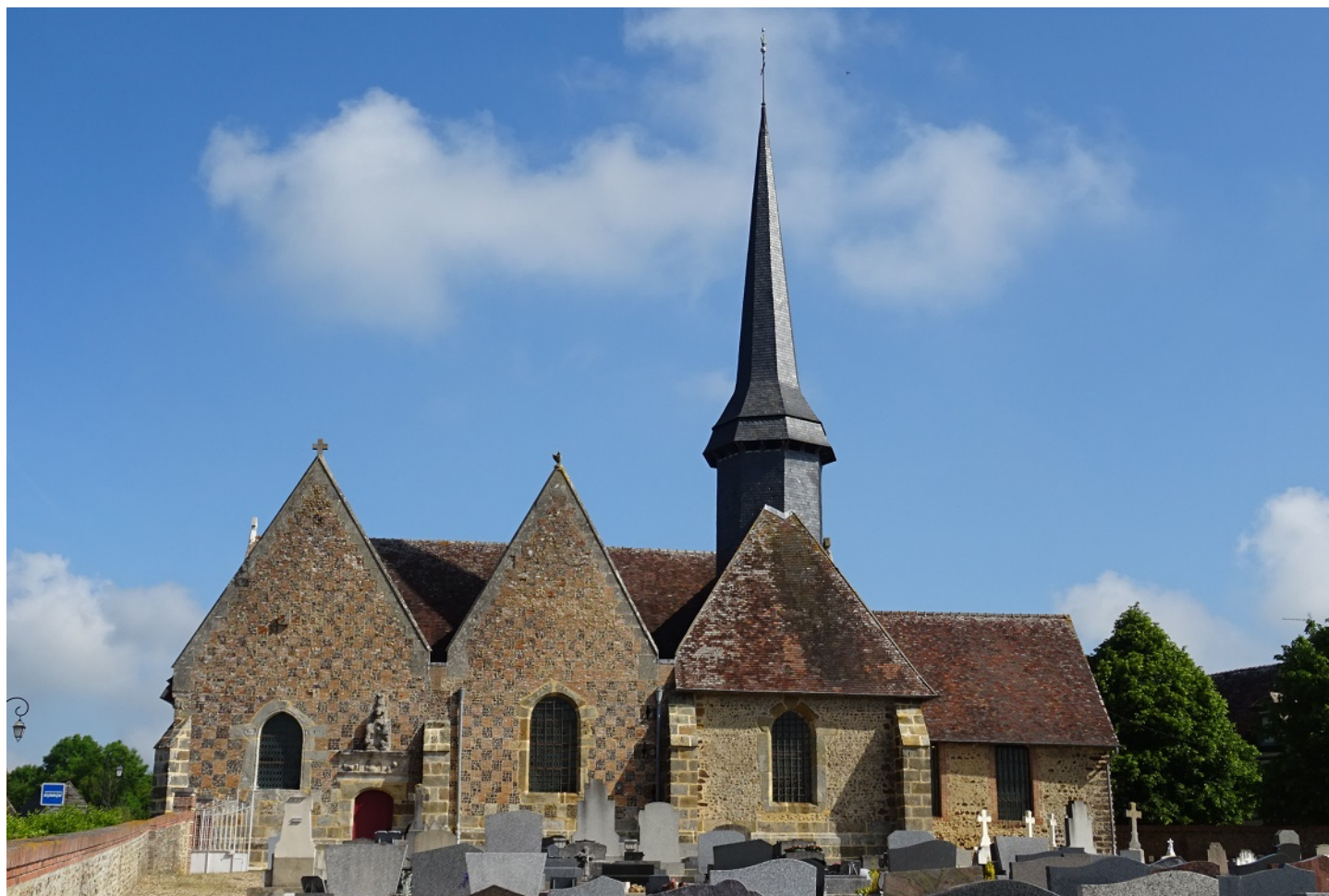
Photographie du monument historique