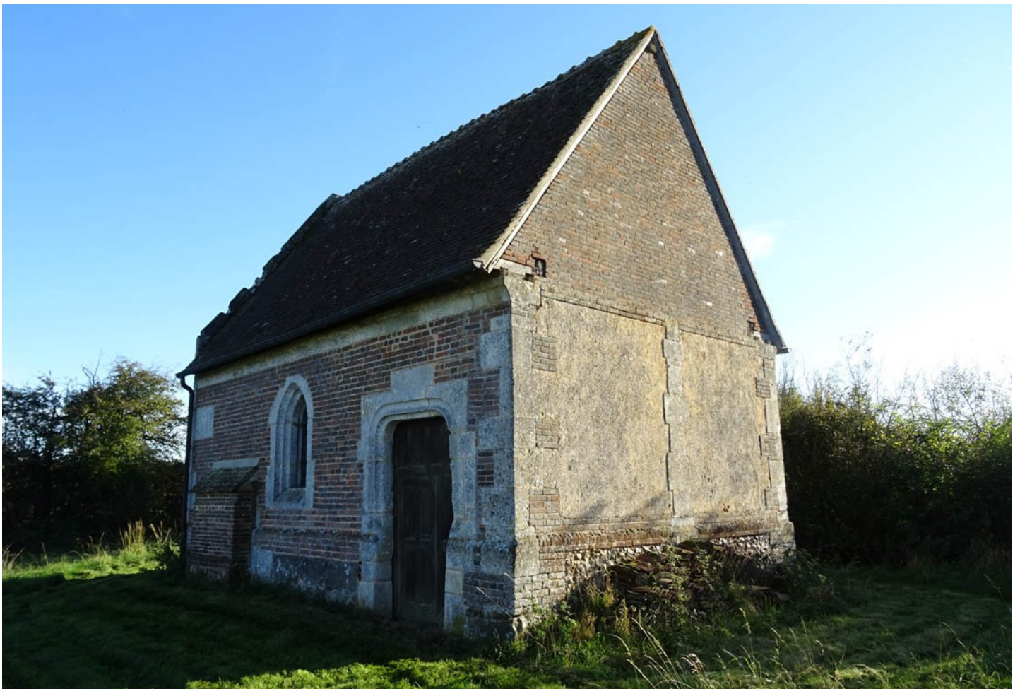
Photographie du monument historique