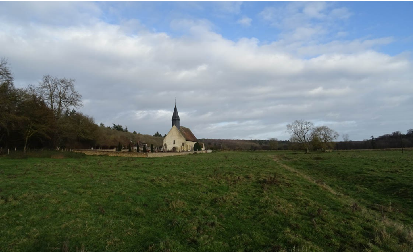
Photographie du monument historique