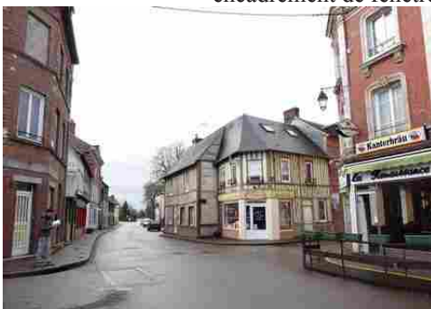
Des maisons à briques et à pans de bois

Les avis seront cohérents avec ceux émis ces dernières années, à savoir : pas de maisons à volume compliqué (type V, W, Y, ou Z), pentes à 45° pour les volumes principaux, ardoise ou tuile plate de teinte brun vieilli, à 20u/m 2 , avec un débord de toiture de 20cm, enduit de teinte beige clair avec modénatures (au choix : chaînages, encadrement de fenêtres, soubassement, colombage...). *Voir les autres fiches.