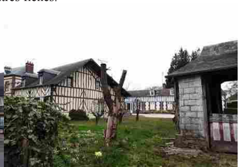
Des constructions à pans de bois