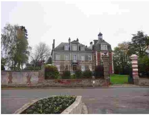
Le château vu de la place au Sud