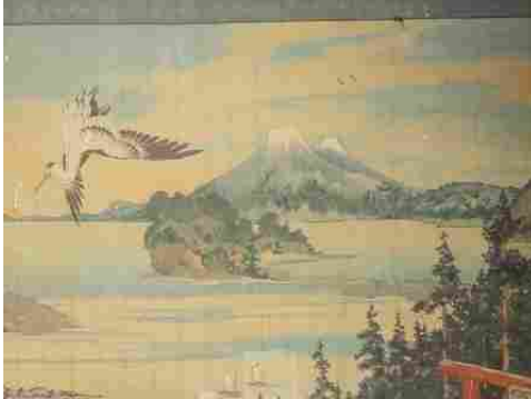
Des détails de toiles peintes