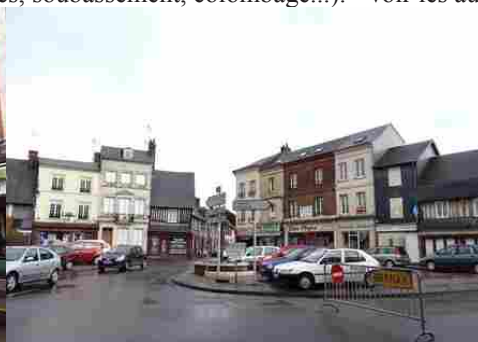
La variété des matériaux en façade