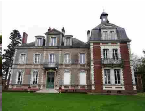
La façade sud du château (vue proche)