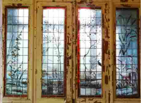
Les vitraux Art Nouveau

Pour la zone en rose foncé dans le périmètre de 500m