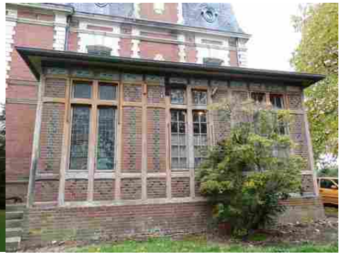
La véranda, accolée à la façade est