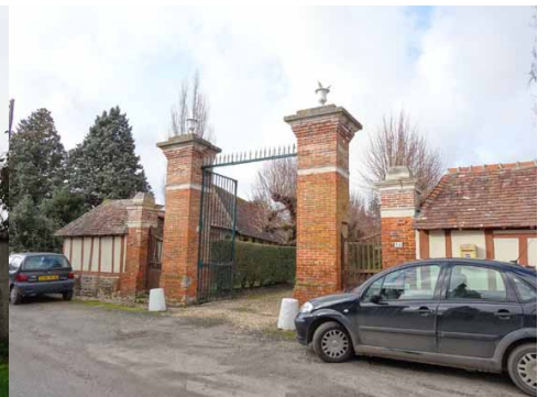
Constructions dans le bourg centre