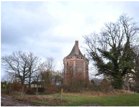
La tour de Thevray