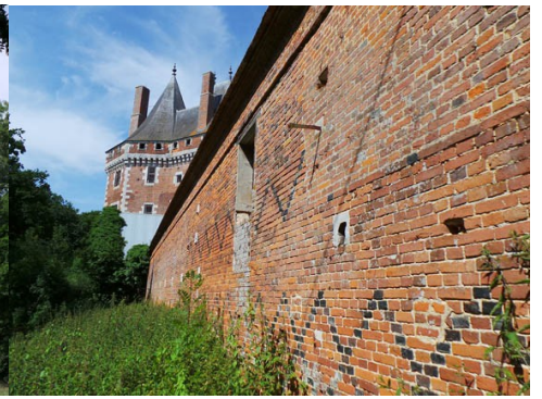
Le mur extérieur des communs