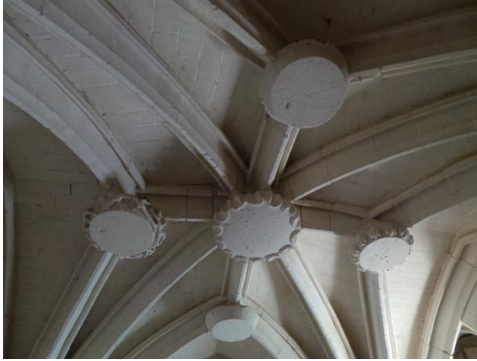
Vue des plafonds intérieur