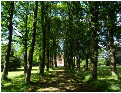
L'allée plantée au Sud du château