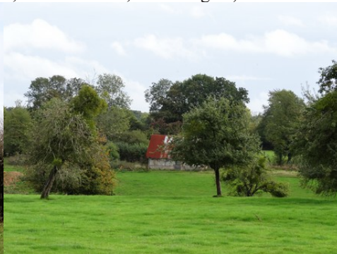
La campagne voisine