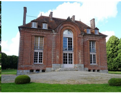
La façade sud