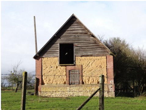
Un exemple d'architecture rurale

Les avis seront cohérents avec ceux émis ces derniers années, à savoir : pas de maisons à volume compliqué (type V, W, Y, ou Z), pentes à 45° pour les volumes principaux, ardoise ou tuile plate de teinte brun vieilli, à 20u/m 2 , avec un débord de toiture de 20cm, enduit de teinte beige clair avec modénatures (au choix : chaînages, encadrement de fenêtres, soubassement, colombage...). *Voir les autres fiches.