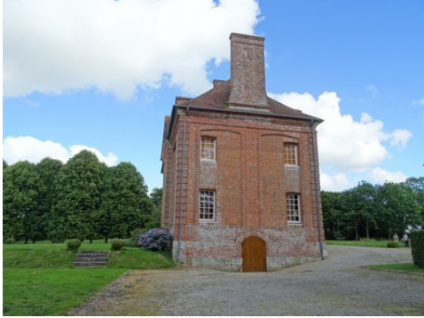
La façade ouest