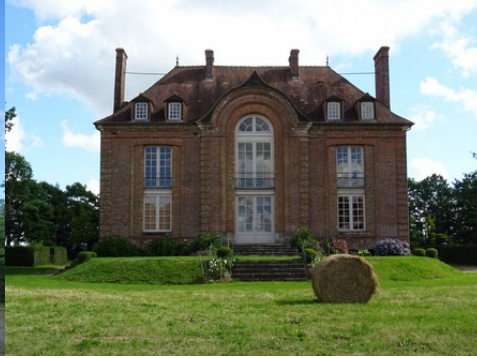
La façade nord