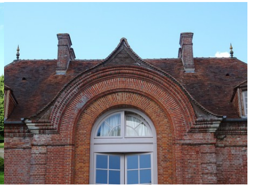
Un détail de l'arcade centrale en briques