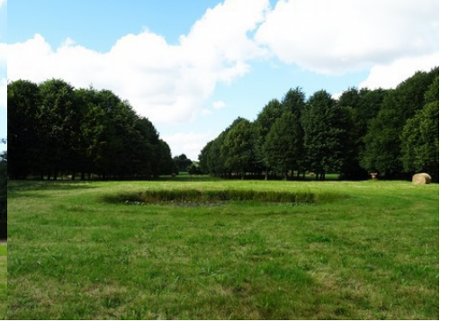
La perspective vers le Nord

Pour la zone en rose foncé dans le périmètre de 500m