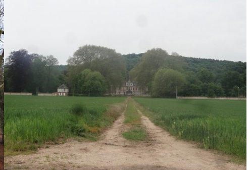
Le château vu des champs à l'Est

Il est préférable d'éviter les constructions qui viendraient au dessus de la ligne de paysage existante (maison à deux niveaux, bâtiments agricoles de type silo, château d'eau, éolienne...). Les constructions nouvelles devront respecter le style existant : maisons parallélépipédiques (pas de V, W, X, Y ou Z). Les toitures seront à minima à 45° pour de l'ardoise ou de la tuile plate de teinte brun vieilli à rouge vieilli à 20u/m 2 . Les pignons seront droits (pas de croupe ou à 65°). Les constructions seront Rez-de-Chaussée plus combles (mais pas R+1+C). Les constructions en brique et colombage sont à préserver et à développer. Les enduits ne seront ni blanc, ni gris, ni noir mais plutôt dans les beiges (clair ou foncé) et ocre léger (mais pas toulousain). Des modénatures seront réalisées en soubassement mais aussi autour des baies (portes et fenêtres) de manière privilégiée en pierre, en brique ou en colombage. Les portails et murs seront en adéquation avec l'environnement proche. Les rives de toiture seront débordantes de 20 cm. La bichromie architecturale des façades devra être recherchée.