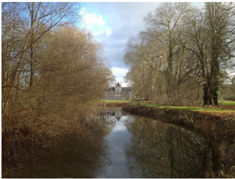
Le château depuis la pièce d'eau du parc