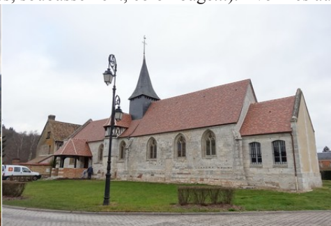
L'église de Pinterville