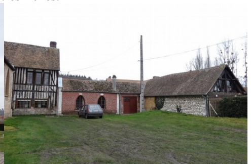
Les abords de l'église