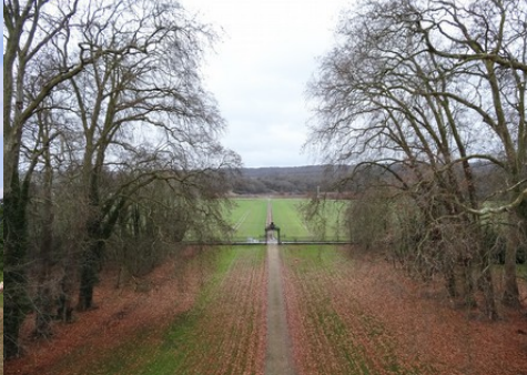
La perspective vers l'Est

Pour la zone en rose foncé dans le périmètre de 500m