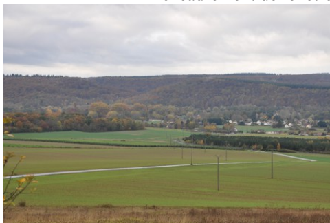
La vue vers Pinterville depuis l'Est

Les avis seront cohérents avec ceux émis ces dernières années, à savoir : pas de maisons à volume compliqué (type V, W, Y, ou Z), pentes à 45° pour les volumes principaux, ardoise ou tuile plate de teinte brun vieilli, à 20u/m 2 , avec un débord de toiture de 20cm, enduit de teinte beige clair avec modénatures (au choix : chaînages, encadrement de fenêtres, soubassement, colombage...). *Voir les autres fiches.