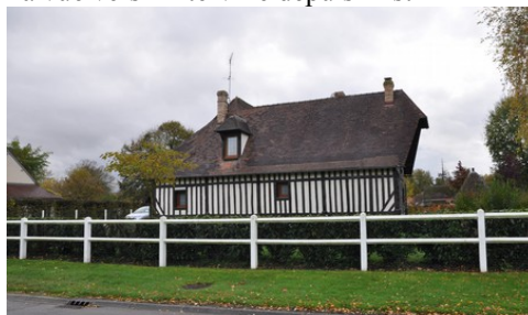
Une maison à pans de bois