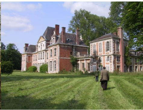
La façade ouest et le parc arboré