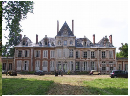
La façade est du château (vue proche)