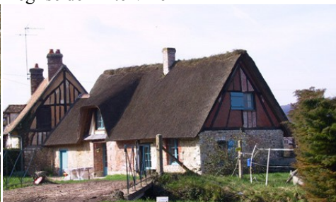
D'autres exemples dans le secteur proche