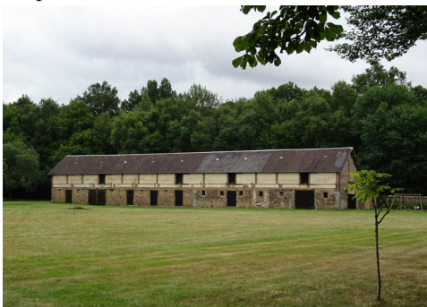
Les bâtiments de la ferme