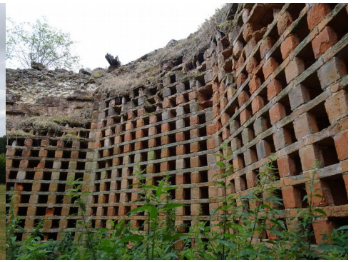
L'intérieur du colombier