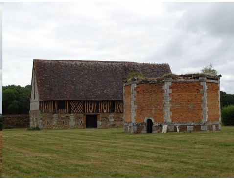
Le colombier octogonal