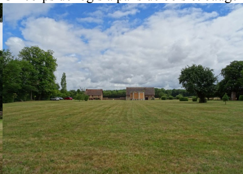
La vue lointaine