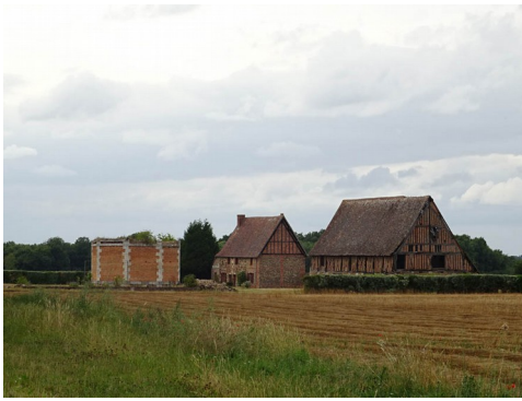
Une vue éloignée du manoir