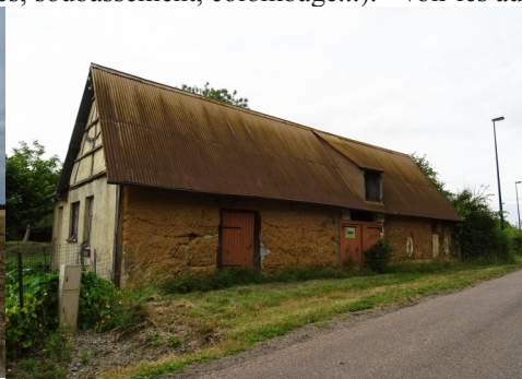
Un corps de logis à pans de bois et bauge