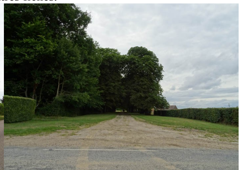
L'allée d'entrée au manoir