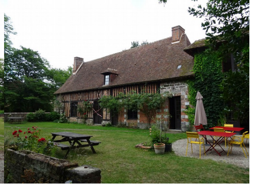
L'intérieur de la cour du manoir

Pour la zone en rose foncé dans le périmètre de 500m