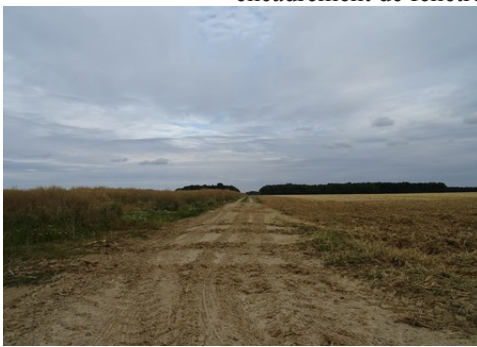
La plaine cultivée au Sud-Est

Les avis seront cohérents avec ceux émis ces derniers années, à savoir : pas de maisons à volume compliqué (type V, W, Y, ou Z), pentes à 45° pour les volumes principaux, ardoise ou tuile plate de teinte brun vieilli, à 20u/m 2 , avec un débord de toiture de 20cm, enduit de teinte beige clair avec modénatures (au choix : chaînages, encadrement de fenêtres, soubassement, colombage...). *Voir les autres fiches.