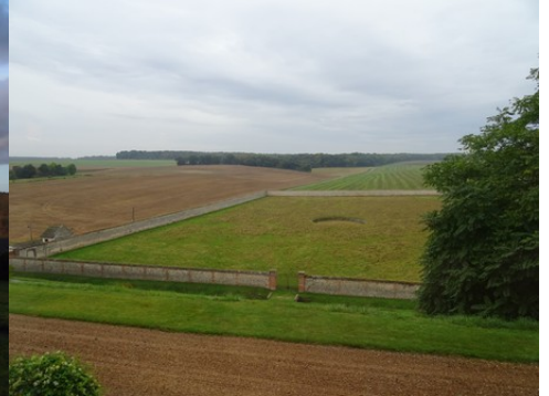
L'enclot du potager depuis le château

Pour la zone en violet-rose dans le périmètre de 500m et au-delà