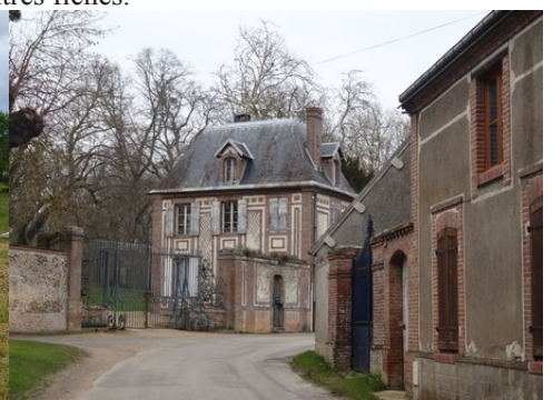
Le bâti rural alentour