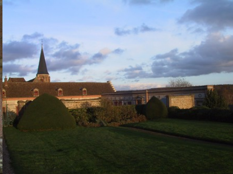
La ferme modèle et les communs