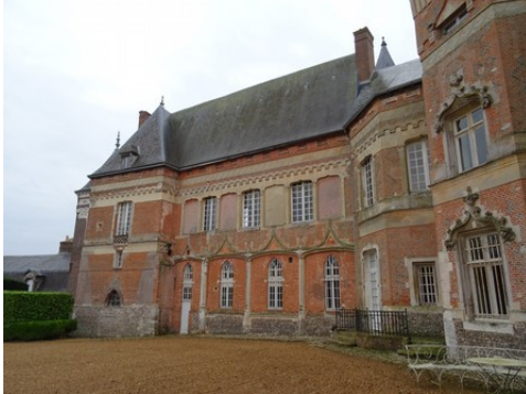
Les décors gothiques du XIXe siècle