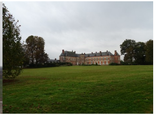
Les deux ailes en équerre (vues de l'est)