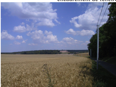
Les champs autour du domaine

Les avis seront cohérents avec ceux émis ces dernières années, à savoir : pas de maisons à volume compliqué (type V, W, Y, ou Z), pentes à 45° pour les volumes principaux, ardoise ou tuile plate de teinte brun vieilli, à 20u/m 2 , avec un débord de toiture de 20cm, enduit de teinte beige clair avec modénatures (au choix : chaînages, encadrement de fenêtres, soubassement, colombage...). *Voir les autres fiches.