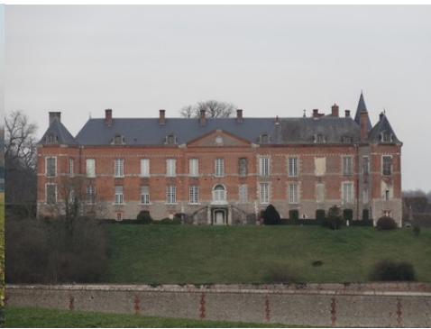
La façade ouest (vue rapprochée)