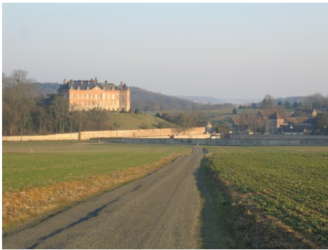
La façade ouest du château