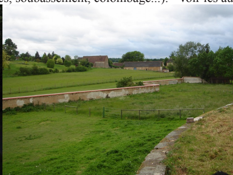
Des prairies et une ferme voisine