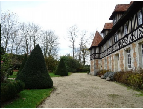
La façade du manoir et son parc