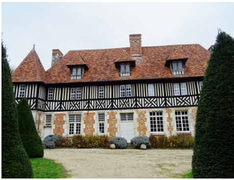
La façade ouest du manoir