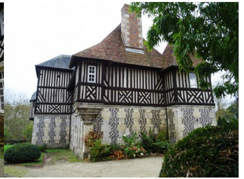
La façade nord