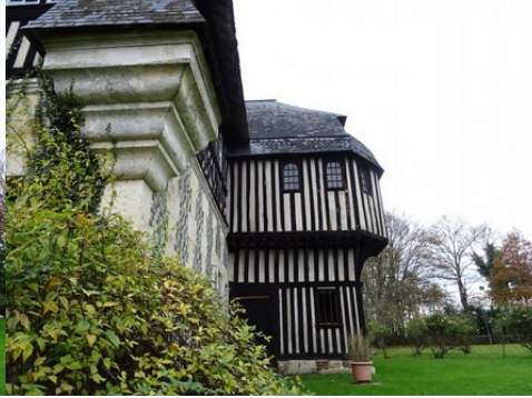
Une vue rapprochée de l'angle sud-est