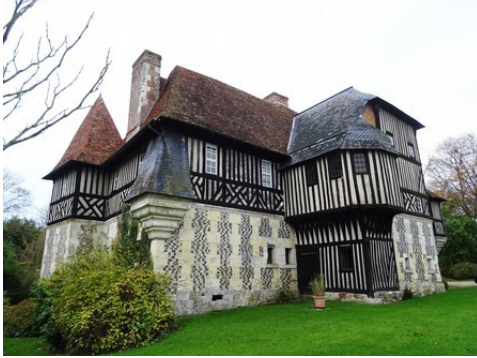
Une vue de la façade est