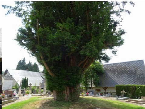
L'if du cimetière