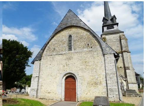
Quelques vues rapprochées de l'église