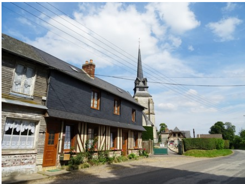
Les abords de l'église

Les avis seront cohérents avec ceux émis ces dernières années, à savoir : pas de maisons à volume compliqué (type V, W, Y, ou Z), pentes à 45° pour les volumes principaux, ardoise ou tuile plate de teinte brun vieilli, à 20u/m 2 , avec un débord de toiture de 20cm, enduit de teinte beige clair avec modénatures (au choix : chaînages, encadrement de fenêtres, soubassement, colombage...). *Voir les autres fiches.