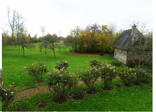
La vue vers le jardin à l'Est