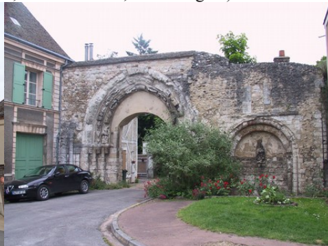
Le portail de l'ancienne abbaye (classé)