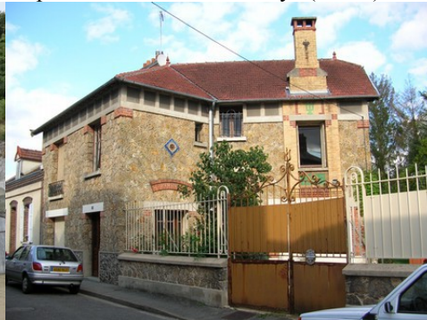
Une maison en meulière