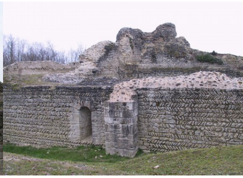
Les vestiges du donjon (vue générale)