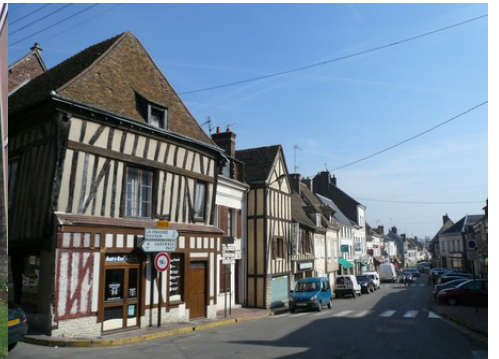
Une vue de la rue Henri IV