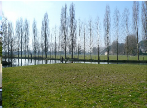
Le paysage de la vallée d'Eure