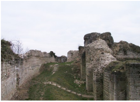
Les vestiges de l'enceinte et du donjon