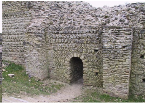
L'appareil des murs en arête de poisson