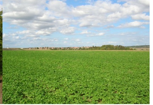
La vue éloignée de l'éperon (Sud-Ouest)