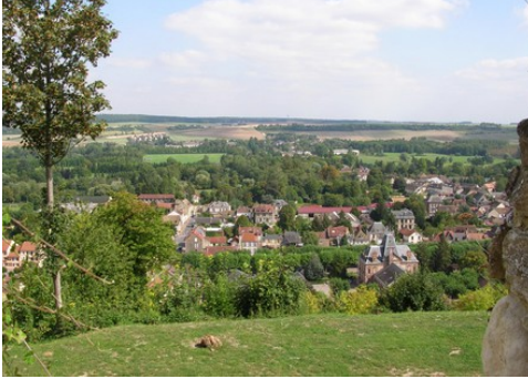
La vue vers Ivry et la vallée d'Eure