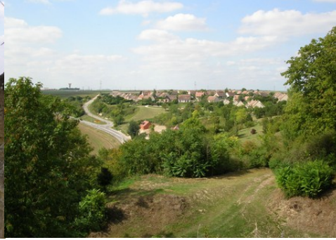
La vue du château vers l'Ouest