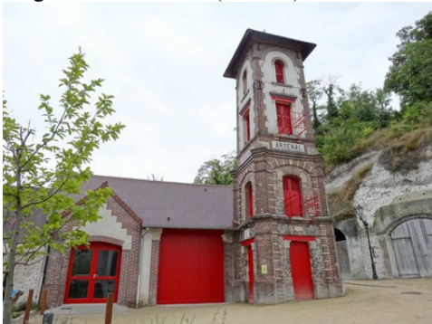
L'arsenal d'Ivry (édifice communal)