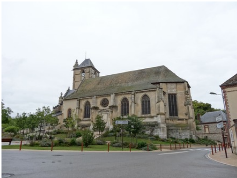
L'église Saint-Martin (inscrite)

Les avis seront cohérents avec ceux émis ces dernières années, à savoir : pas de maisons à volume compliqué (type V, W, Y, ou Z), pentes à 45° pour les volumes principaux, ardoise ou tuile plate de teinte brun vieilli, à 20u/m 2 , avec un débord de toiture de 20cm, enduit de teinte beige clair avec modénatures (au choix : chaînages, encadrement de fenêtres, soubassement, colombage...). *Voir les autres fiches.