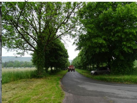
Les parties plantées dans la commune