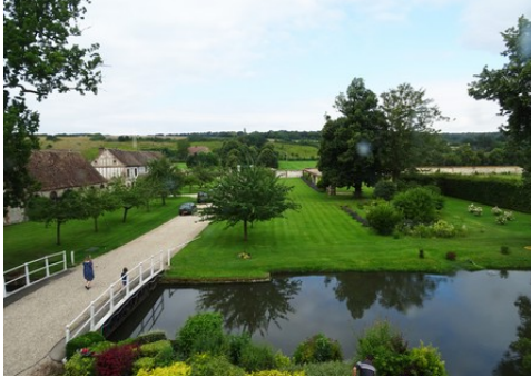
Le vue vers l'Ouest depuis le manoir