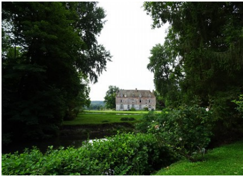
La façade nord (vue éloignée)