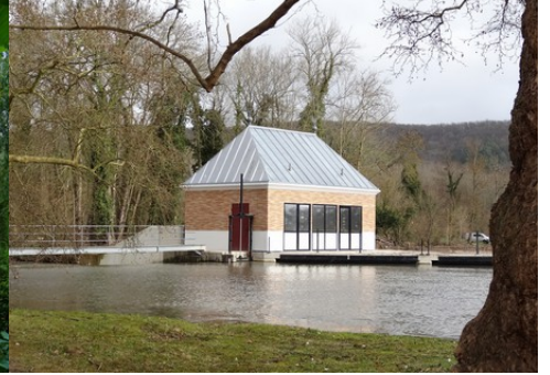
La petite centrale hydraulique du manoir

Pour la zone en rose foncé dans le périmètre de 500m