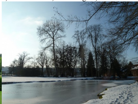
Les berges de l'Eure en hiver