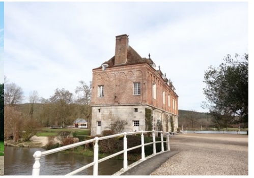
Le manoir vu depuis le pont