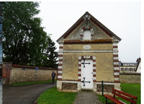
Le bâti avoisinant