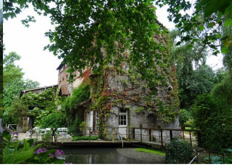
L'ancien moulin du manoir