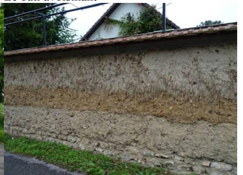
Les murs en bauge