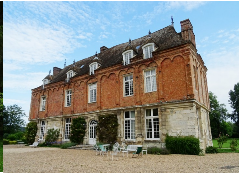
La façade sud du manoir