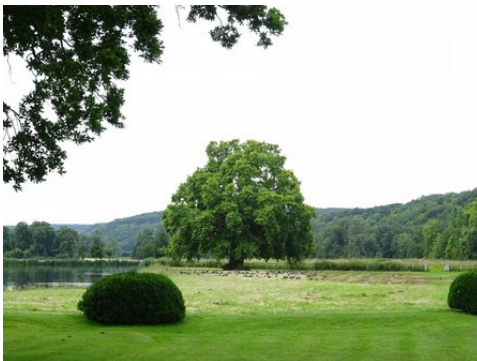
Les prairies et étangs aux alentours

Les avis seront cohérents avec ceux émis ces dernières années, à savoir : pas de maisons à volume compliqué (type V, W, Y, ou Z), pentes à 45° pour les volumes principaux, ardoise ou tuile plate de teinte brun vieilli, à 20u/m 2 , avec un débord de toiture de 20cm, enduit de teinte beige clair avec modénatures (au choix : chaînages, encadrement de fenêtres, soubassement, colombage...). *Voir les autres fiches.