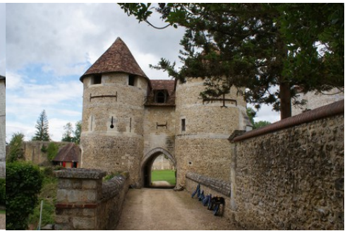
Le châtelet d'entrée de l'extérieur