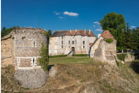
Les vestiges de l'enceinte