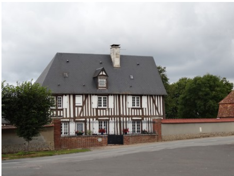
Quelques maisons dans les abords