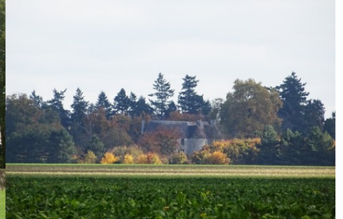
Le château vu de la Croix Poussin

Pour la zone en rose foncé dans le périmètre de 500m