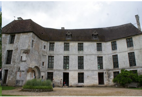
La façade Ouest remaniée fin XVII e