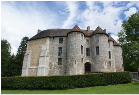
La façade Est du logis