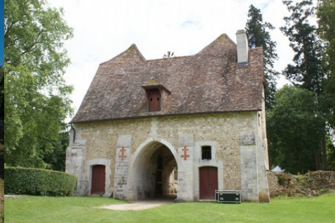
La châtelet d'entrée depuis la basse-cour