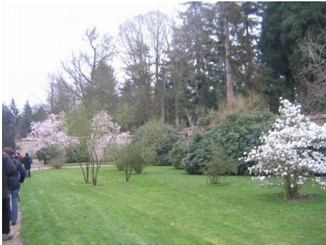
L'arboretum du château

Les avis seront cohérents avec ceux émis ces derniers années, à savoir : pas de maisons à volume compliqué (type V, W, Y, ou Z), pentes à 45° pour les volumes principaux, ardoise ou tuile plate de teinte brun vieilli, à 20u/m 2 , avec un débord de toiture de 20cm, enduit de teinte beige clair avec modénatures (au choix : chaînages, encadrement de fenêtres, soubassement, colombage...). *Voir les autres fiches.