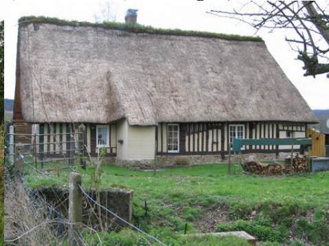
Des exemples d'architecture rurale