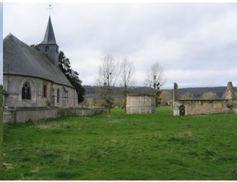
L'église et les vestiges du manoir