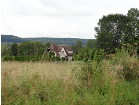
Les champs environnants

Les avis seront cohérents avec ceux émis ces dernières années, à savoir : pas de maisons à volume compliqué (type V, W, Y, ou Z), pentes à 45° pour les volumes principaux, ardoise ou tuile plate de teinte brun vieilli, à 20u/m 2 , avec un débord de toiture de 20cm, enduit de teinte beige clair avec modénatures (au choix : chaînages, encadrement de fenêtres, soubassement, colombage...). *Voir les autres fiches.