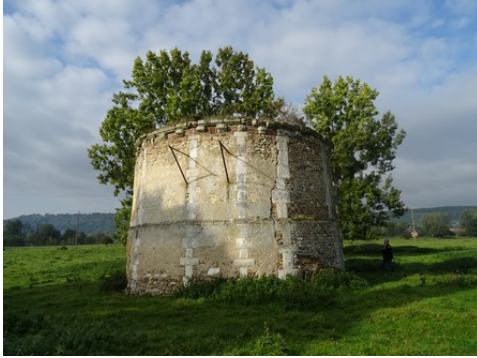
Le colombier circulaire