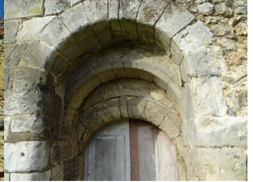
Les arcs de la porte du cellier

Pour la zone en rose foncé dans le périmètre de 500m