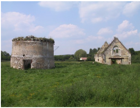
Le logis et le colombier