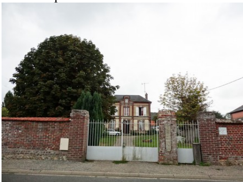
Quelques maisons dans les abords