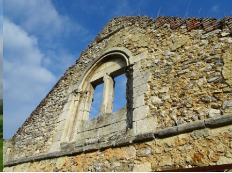
Une baie géminée et ouvragée