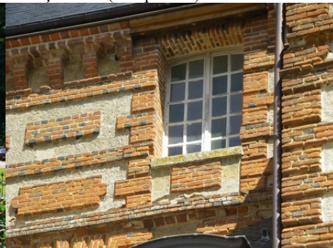
Un détail de façade du logis : briques, enduit