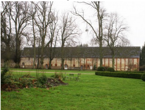
Les dépendances en bordure la cour plantée