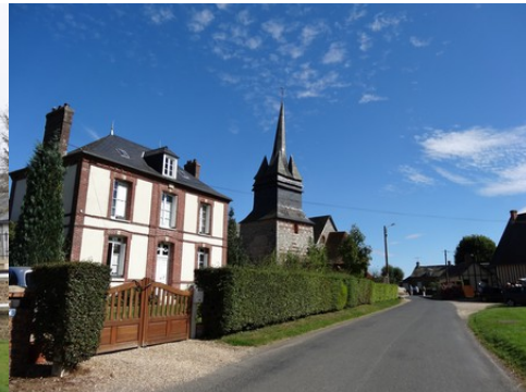
Une vue du village voisin de Beauficel