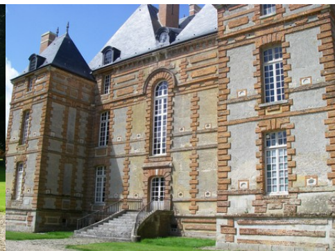
La façade est (vue proche)