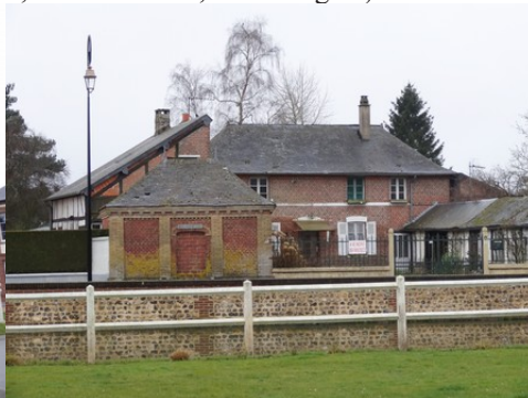
Une maison en briques de Fleury