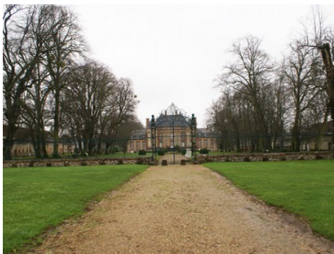
Le château vu de la grille d'honneur