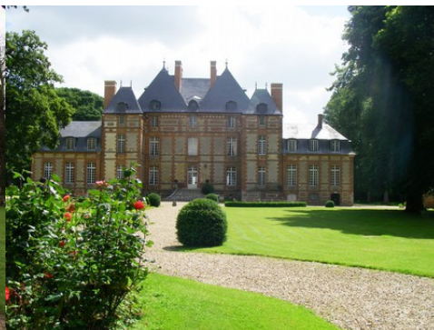
La façade ouest du château (vue proche)