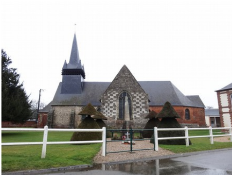
L'église de Fleury la Forêt

Les avis seront cohérents avec ceux émis ces dernières années, à savoir : pas de maisons à volume compliqué (type V, W, Y, ou Z), pentes à 45° pour les volumes principaux, ardoise ou tuile plate de teinte brun vieilli, à 20u/m 2 , avec un débord de toiture de 20cm, enduit de teinte beige clair avec modénatures (au choix : chaînages, encadrement de fenêtres, soubassement, colombage...). *Voir les autres fiches.