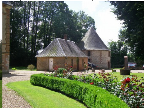
Le colombier circulaire et un pavillon