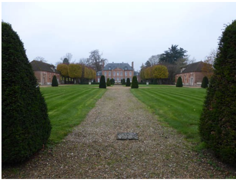
Vue éloignée de la façade Nord