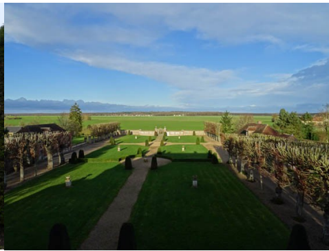
Vue depuis la façade nord