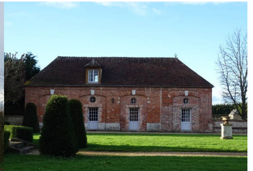
Les communs du château