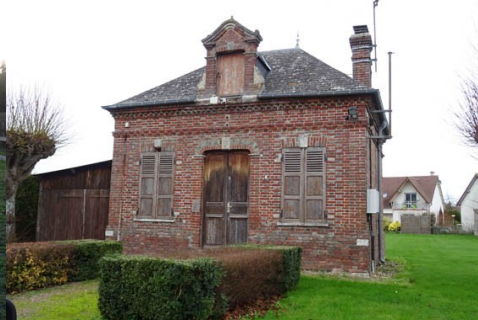
L'ancienne mairie en brique