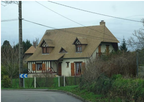
Quelques maisons dans les abords