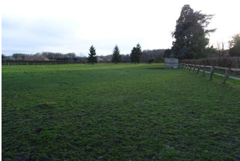
La motte féodale

Les avis seront cohérents avec ceux émis ces dernières années, à savoir : pas de maisons à volume compliqué (type V, W, Y, ou Z), pentes à 45° pour les volumes principaux, ardoise ou tuile plate de teinte brun vieilli, à 20u/m 2 , avec un débord de toiture de 20cm, enduit de teinte beige clair avec modénatures (au choix : chaînages, encadrement de fenêtres, soubassement, colombage...). *Voir les autres fiches.