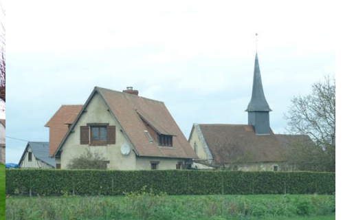
Le bâti rural avoisinant