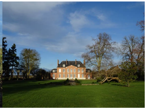
La façade Sud