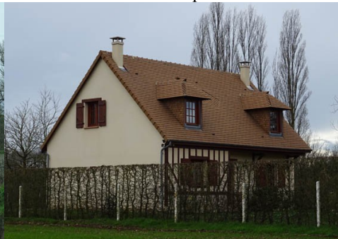
Le colombage est bien présent