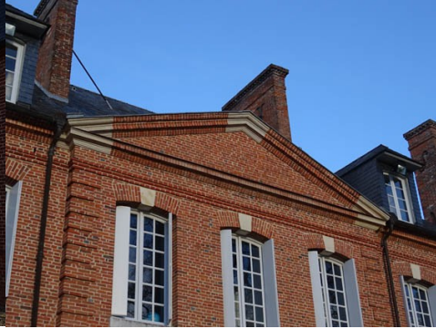
Le fronton sud

Pour la zone en rose foncé dans le périmètre de 500m