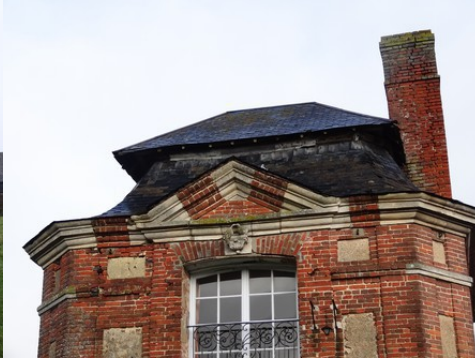
Le détail d'un fronton (aile est)