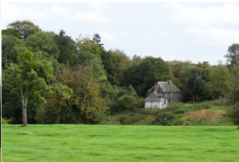
La campagne environnante