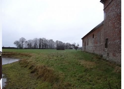
La prairie avec une mare

Pour la zone en rose foncé dans le périmètre de 500m