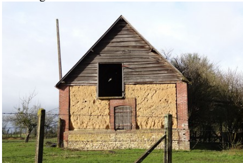
Un exemple d'architecture rurale