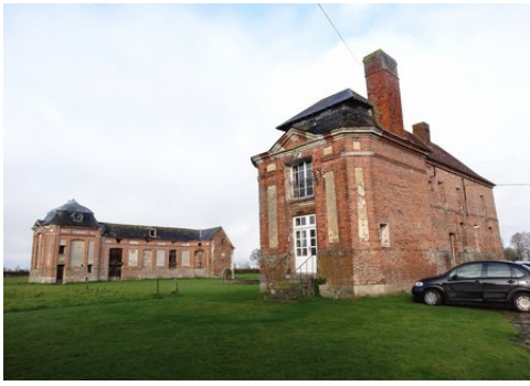
Les deux ailes et leurs pavillons