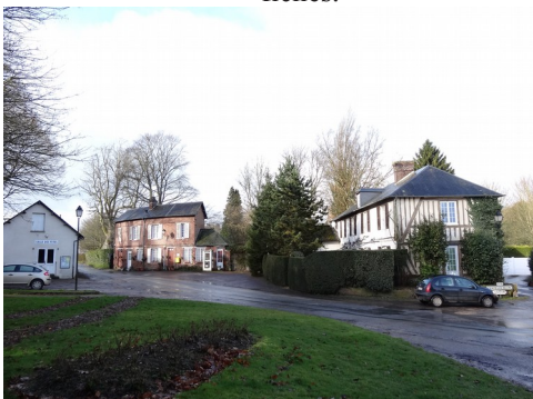
Le village de Drucourt

Les avis seront cohérents avec ceux émis ces dernières années, à savoir : pas de maisons à volume compliqué (type V, W, Y, ou Z), Rez-de-chaussée + Combles, pentes à 45° pour les volumes principaux, ardoise ou tuile plate de teinte brun vieilli, à 20u/m², avec un débord de toiture de 20cm, enduit de teinte beige clair avec modénatures (au choix : chaînages, encadrement de fenêtres, soubassement, colombage...). *Voir les autres fiches.