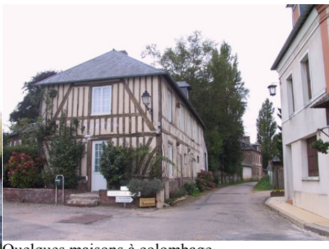
Quelques maisons à colombage