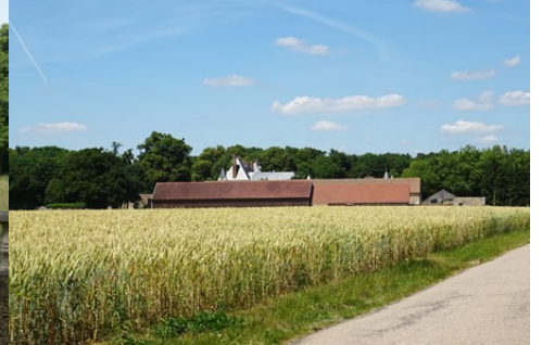
Le château vu de la route de Douains

Pour la zone en rose foncé dans le périmètre de 500m