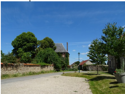
Quelques maisons dans Douains