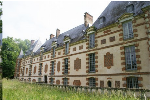
La façade ouest (vue rapprochée)