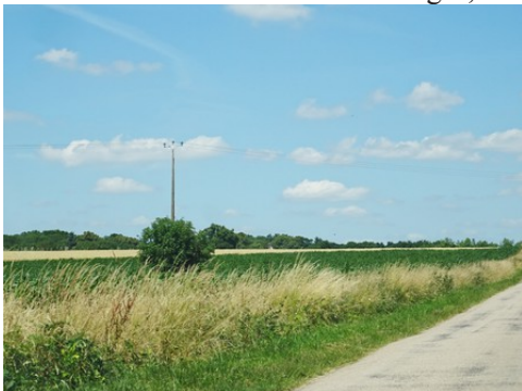
Les champs alentours

Les avis seront cohérents avec ceux émis ces dernières années, à savoir : pas de maisons à volume compliqué (type V, W, Y, ou Z), pentes à 45° pour les volumes principaux, ardoise ou tuile plate de teinte brun vieilli, à 20u/m 2 , avec un débord de toiture de 20cm, enduit de teinte beige clair avec modénatures (au choix : chaînages, encadrement de fenêtres, soubassement, colombage...). *Voir les autres fiches.