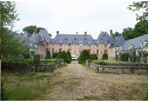
Le château et la cours d'honneur