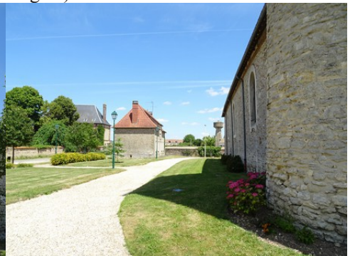
Le bâti rural avoisinant