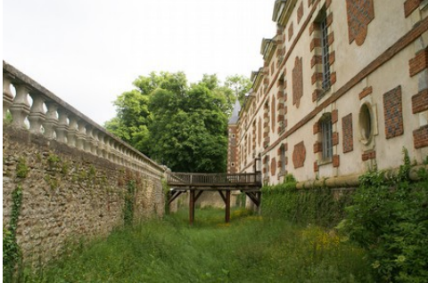
Les douves et la façade ouest