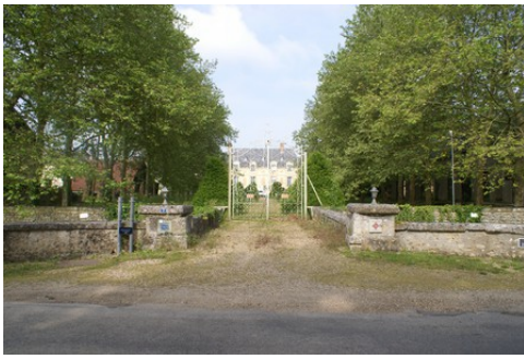
Le château vu du portail d'entrée