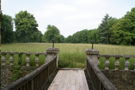
La vue sur le parc arboré