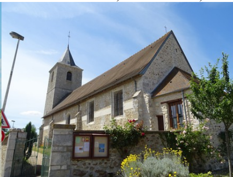
L'église de Douains