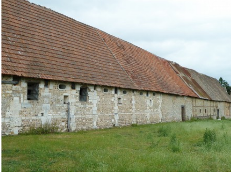
Les anciennes dépendances vues du Sud