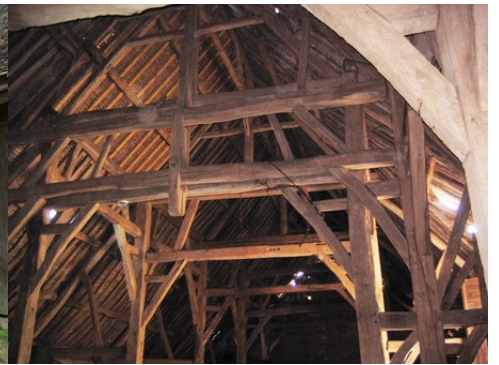
La façade principale