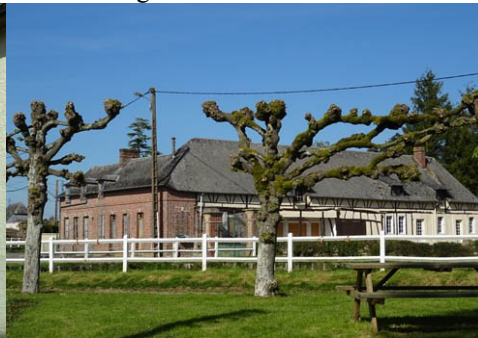
Au niveau de la place