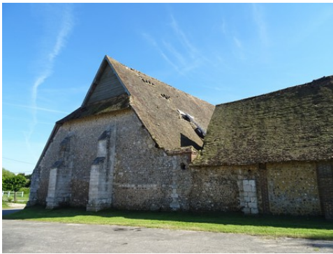
Le pignon nord de la grange