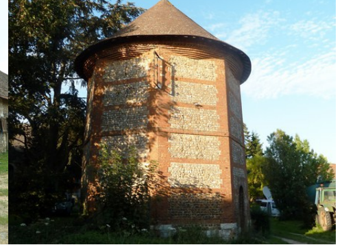
Le colombier octogonal du manoir

Pour la zone en rose foncé dans le périmètre de 500m