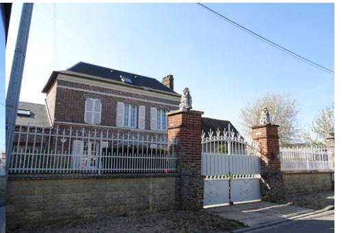
Maison en brique