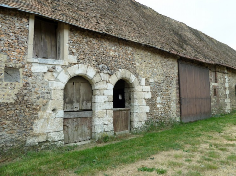
Les dépendances vues de la cour