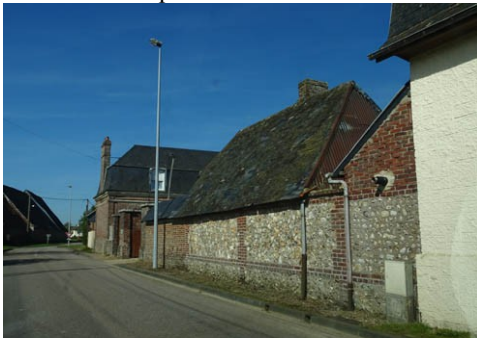
Face au monument