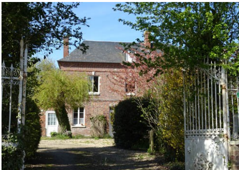
Maison en brique

Les avis seront cohérents avec ceux émis ces derniers années, à savoir : pas de maisons à volume compliqué (type V, W, Y, ou Z), pentes à 45° pour les volumes principaux, ardoise ou tuile plate de teinte brun vieilli, à 20u/m 2 , avec un débord de toiture de 20cm, enduit de teinte beige clair avec modénatures (au choix : chaînages, encadrement de fenêtres, soubassement, colombage...). *Voir les autres fiches.