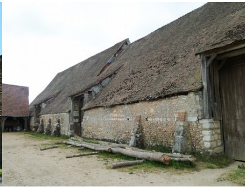
La grange vue de la cour du manoir