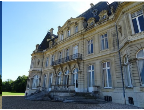
La façade est du château