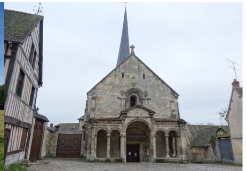
L'église de Dangu (classée MH)