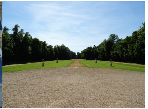
La perspective vers l'Ouest