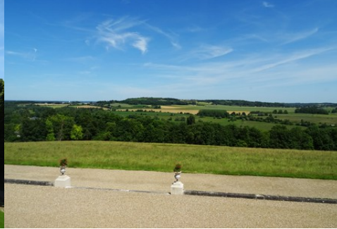
La vue lointaine vers l'Est