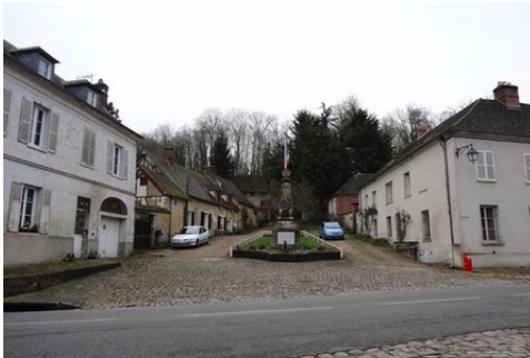
Quelques maisons dans les abords