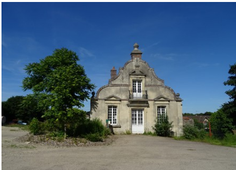
Un ancien commun voisin du château

Les avis seront cohérents avec ceux émis ces dernières années, à savoir : pas de maisons à volume compliqué (type V, W, Y, ou Z), pentes à 45° pour les volumes principaux, ardoise ou tuile plate de teinte brun vieilli, à 20u/m 2 , avec un débord de toiture de 20cm, enduit de teinte beige clair avec modénatures (au choix : chaînages, encadrement de fenêtres, soubassement, colombage...). *Voir les autres fiches.