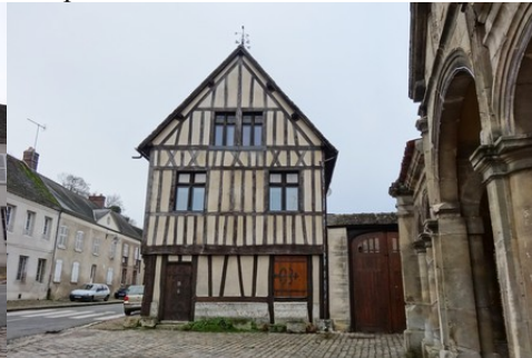
Une maison à pans de bois