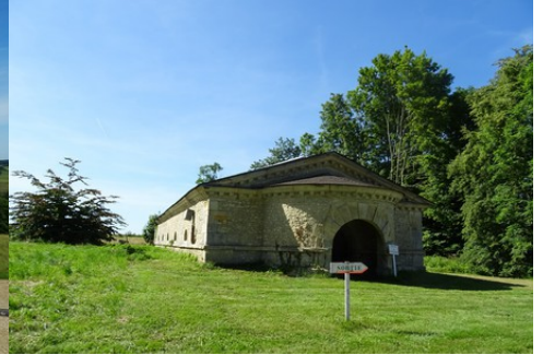
L'ancien château d'eau du XVIII e siècle

Pour la zone en rose foncé dans le périmètre de 500m