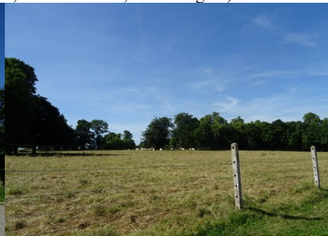
Une prairie aux alentours