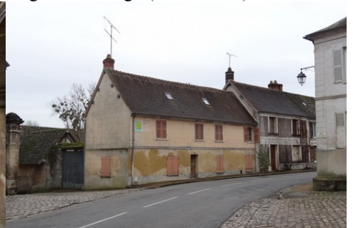
Une maison en pierre de taille