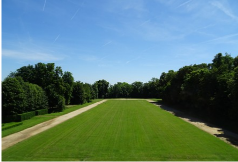
La perspective vers le Sud