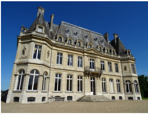
La façade ouest du château