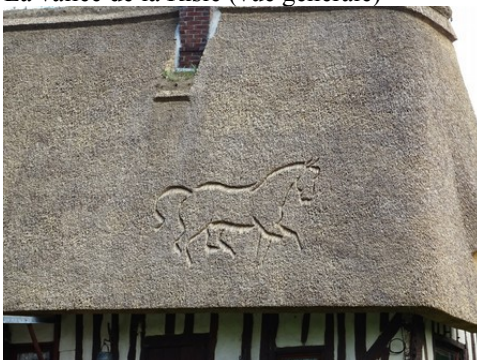
La personnalisation du toit en chaume