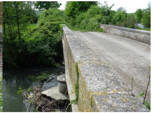
La pile centrale à bec et le parapet