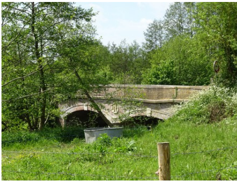
Le Pont Napoléon (vue éloignée)