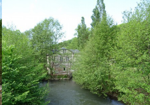
Les vues sur la vallée de la Risle