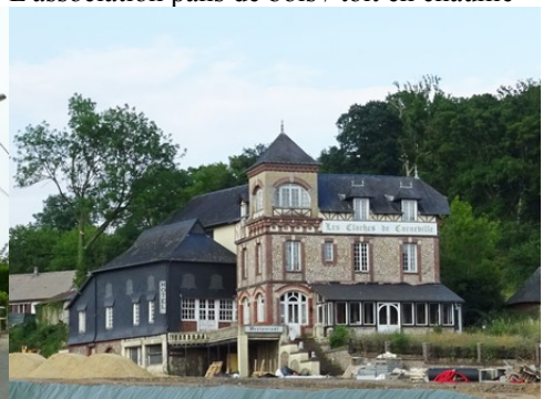
L'auberge des Cloches de Corneville