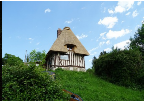
L'association pans de bois / toit en chaume