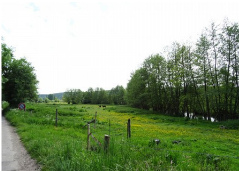
La vallée de la Risle (vue générale)

Les avis seront cohérents avec ceux émis ces dernières années, à savoir : pas de maisons à volume compliqué (type V, W, Y, ou Z), pentes à 45° pour les volumes principaux, ardoise ou tuile plate de teinte brun vieilli, à 20u/m², avec un débord de toiture de 20cm, enduit de teinte beige clair avec modénatures (au choix : chaînages, encadrement de fenêtres, soubassement, colombage...). *Voir les autres fiches.