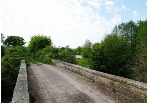
La chaussée et l'environnement du pont