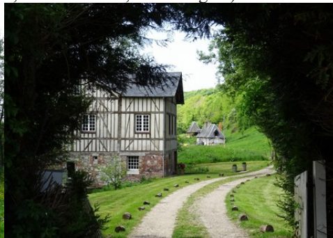
Le bâti voisins, à pans de bois