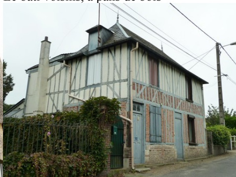
Un autre exemple de maison ancienne