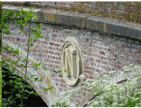
Le N de Napoléon III en médaillon