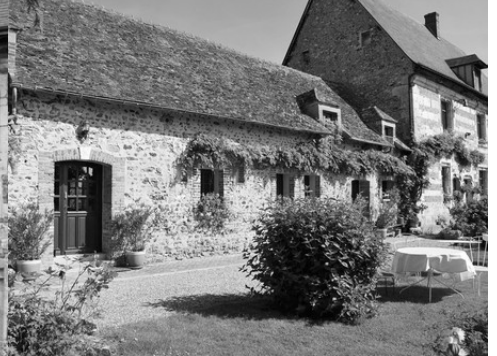
Les dépendances attenantes

Pour la zone en rose foncé dans le périmètre de 500m