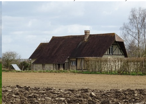
Une maison à pans de bois et toiture haute