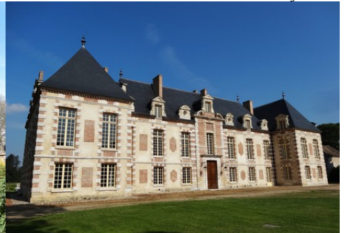
Le château de la Croix Saint-Leufroy