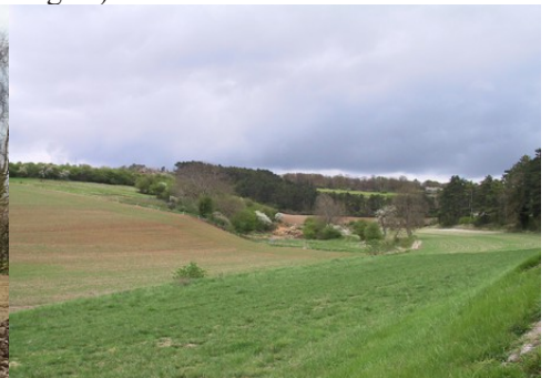
Le vallon vers la Croix Saint-Leufroy