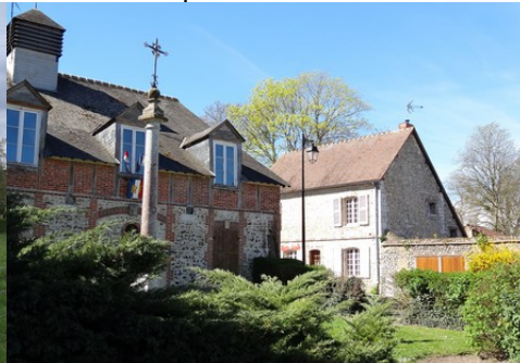
Le recours à la briques et aux moellons