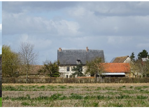
La façade sud vue des champs