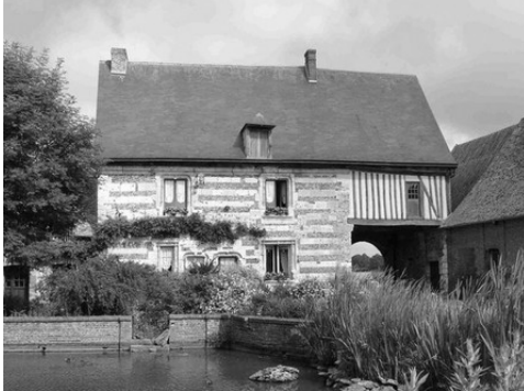
La façade sud du manoir, sur cour