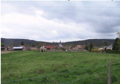
Le village de la Croix Saint-Leufroy