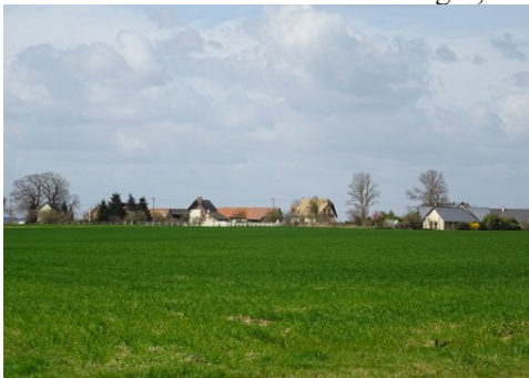
Le hameau de la Boissaye vu des champs

Les avis seront cohérents avec ceux émis ces derniers années, à savoir : pas de maisons à volume compliqué (type V, W, Y, ou Z), pentes à 45° pour les volumes principaux, ardoise ou tuile plate de teinte brun vieilli, à 20u/m 2 , avec un débord de toiture de 20cm, enduit de teinte beige clair avec modénatures (au choix : chaînages, encadrement de fenêtres, soubassement, colombage...). *Voir les autres fiches.