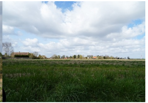
Une vue lointaine depuis la RD10