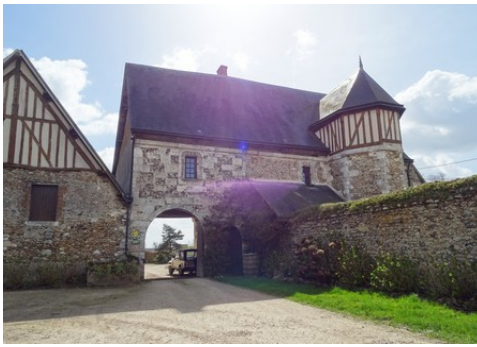
La façade nord et l'entrée du manoir