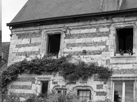
Les ancienne baies (vue proche)