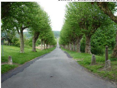
L'allée du château