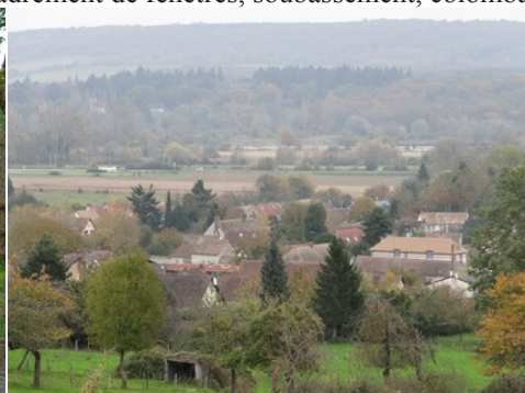
Les couleurs environnantes