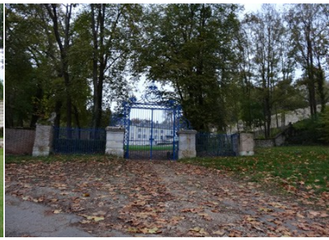
La grille d'entrée