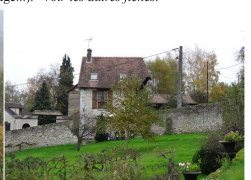
Exemple de construction