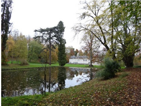
Les pièces d'eau