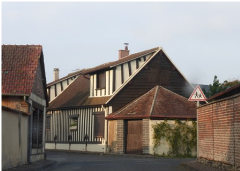
Quelques rues d'Avrilly

Les avis seront cohérents avec ceux émis ces derniers années, à savoir : pas de maisons à volume compliqué (type V, W, Y, ou Z), pentes à 45° pour les volumes principaux, ardoise ou tuile plate de teinte brun vieilli, à 20u/m 2 , avec un débord de toiture de 20cm, enduit de teinte beige clair avec modénatures (au choix : chaînages, encadrement de fenêtres, soubassement, colombage...). *Voir les autres fiches.