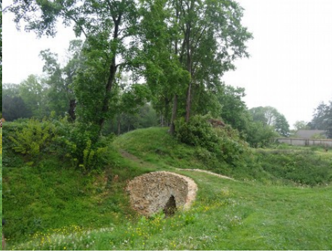
Les anciens fossés de la basse-cour