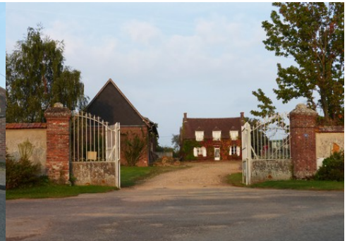
L'entrée d'un corps de ferme