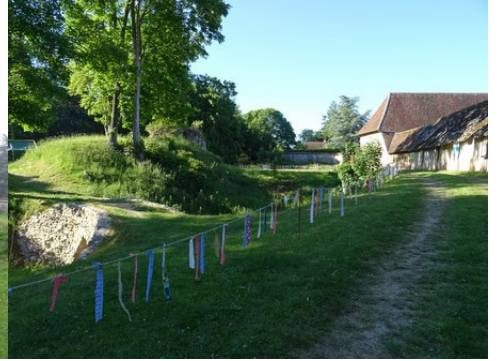
Les fossés et le corps de ferme voisin

Pour la zone en rose foncé dans le périmètre de 500m