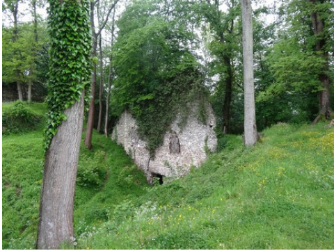
Des vestiges de fortification