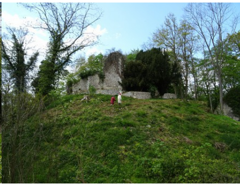
Des vues proches du donjon