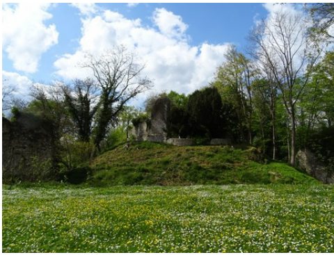
La motte castrale et le donjon