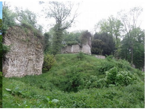
Les fossés entourant la motte