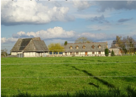
Une ferme à pans de bois et toitures hautes