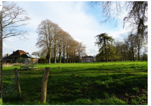
Le château et son parc arboré