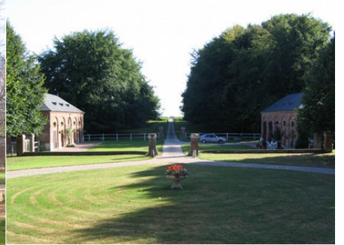
La perspective sud vue depuis le château