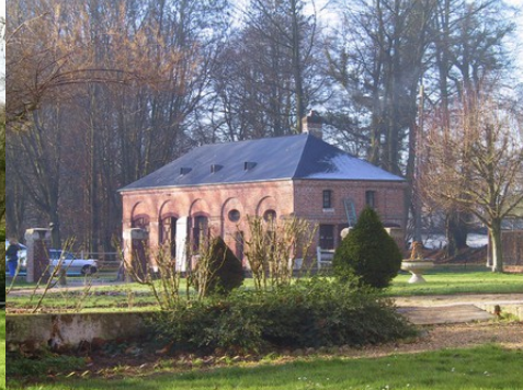
L'aile ouest des communs