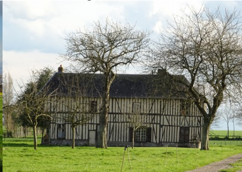
Une maison en pans de bois