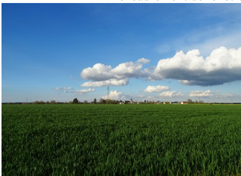
Le grand paysage de plaines cultivées

Les avis seront cohérents avec ceux émis ces dernières années, à savoir : pas de maisons à volume compliqué (type V, W, Y, ou Z), pentes à 45° pour les volumes principaux, ardoise ou tuile plate de teinte brun vieilli, à 20u/m 2 , avec un débord de toiture de 20cm, enduit de teinte beige clair avec modénatures (au choix : chaînages, encadrement de fenêtres, soubassement, colombage...). *Voir les autres fiches.