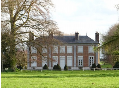
La façade nord du château