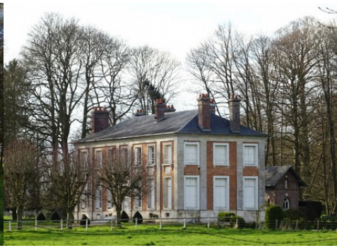
L'angle sud-est du château vu de la route