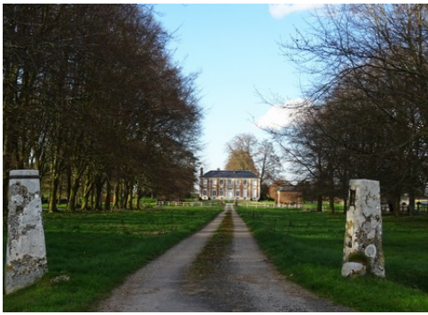
Le château et sa perspective depuis l'entrée