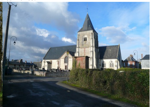
L'église voisine d'Etréville (inscrite MH)