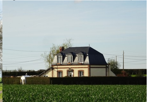
Un pavillon avec briques et ardoises