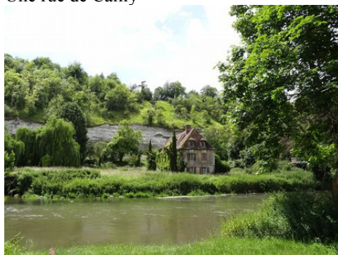
La rivière d'Eure et ses côteaues