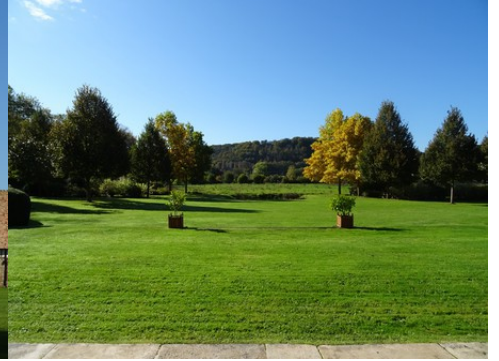
La vue vers l'Eure et ses côteaues boisés

Pour la zone en rose foncé dans le périmètre de 500m