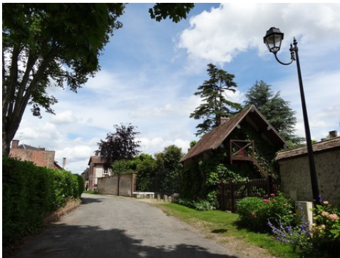
Une rue de Cailly

Les avis seront cohérents avec ceux émis ces derniers années, à savoir : pas de maisons à volume compliqué (type V, W, Y, ou Z), pentes à 45° pour les volumes principaux, ardoise ou tuile plate de teinte brun vieilli, à 20u/m 2 , avec un débord de toiture de 20cm, enduit de teinte beige clair avec modénatures (au choix : chaînages, encadrement de fenêtres, soubassement, colombage...). *Voir les autres fiches.