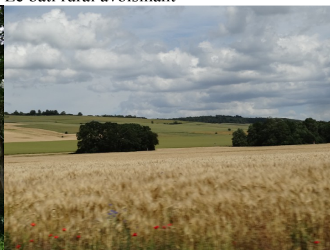
Les plaines et collines cultivées