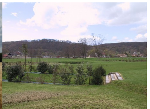
Les prairies et le village de Cailly