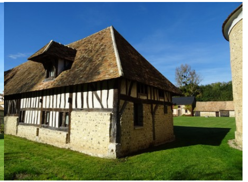
Une ancienne grange