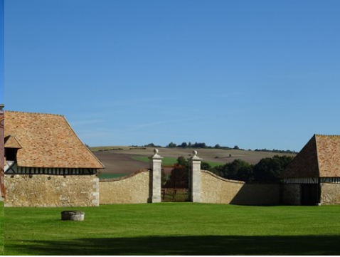
La vue vers les collines cultivées à l'Est