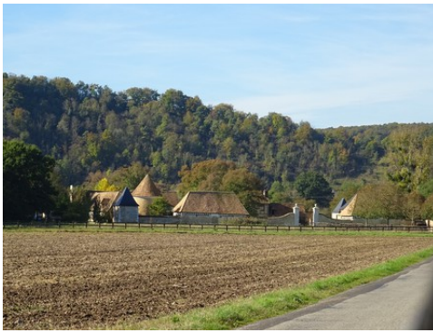
Le manoir vu depuis la route à l'Est