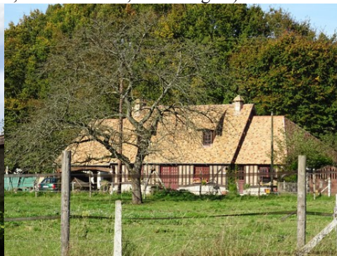
Le bâti rural avoisinant