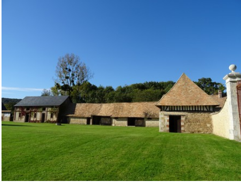
La cour enherbée du manoir