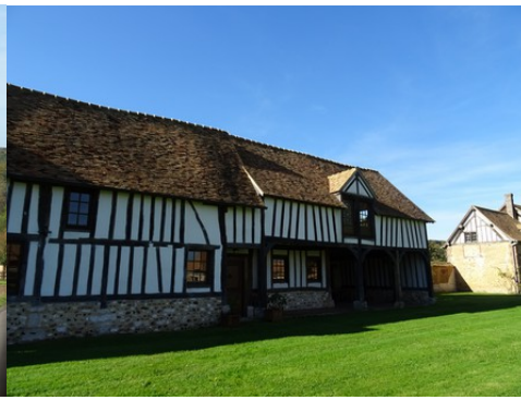
L'ancien logis d'exploitation du domaine