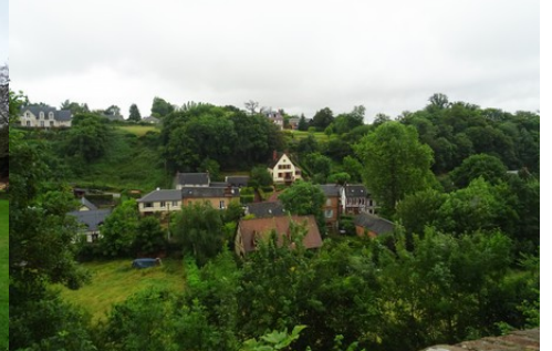
La vue depuis la galerie du château

Pour la zone en rose foncé dans le périmètre de 500m