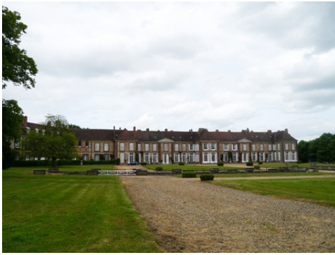
Le corps de logis (vue éloignée)