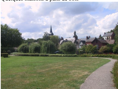
Le village depuis la Charentonne