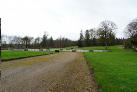
Le parc arboré