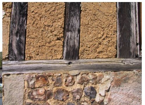
Différents matériaux (bauge, bois, silex)