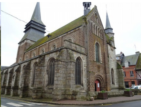
L'église de Broglie (classée MH)