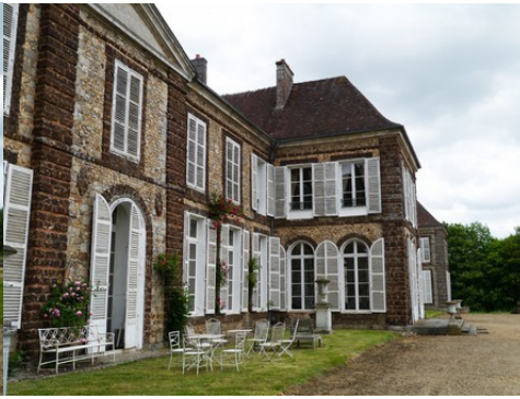
Le corps de logis (vues rapprochées)