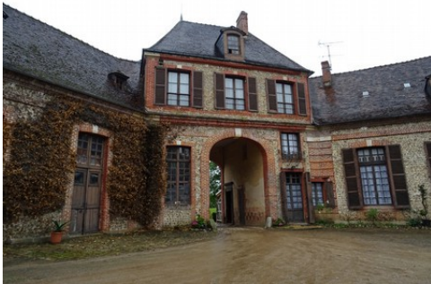
Le pavillon d'entrée