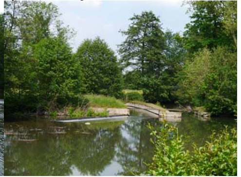
Vue sur les deux bras forcés de l'Iton

Pour la zone bleu foncé dans le périmètre de 500m