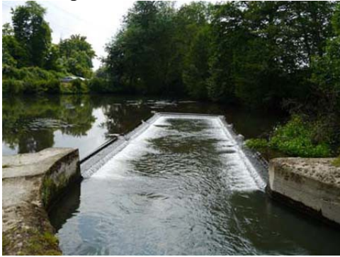
Bassin et bras forcé de l'Iton