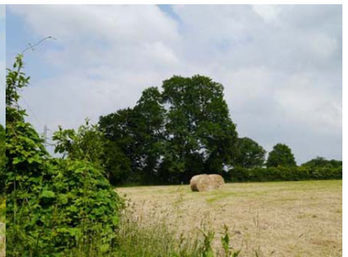
Abords immédiats et environnement