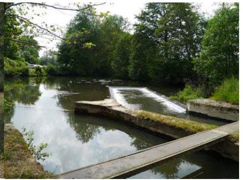
Système de répartition des débits