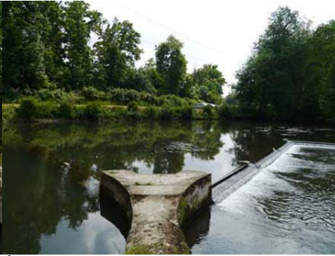
Épi ou bec donnant son nom au Becquet