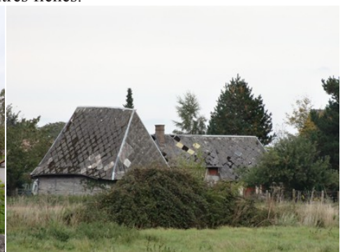
L'habitat rural alentours