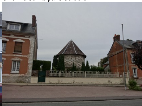
Un ancien colombier