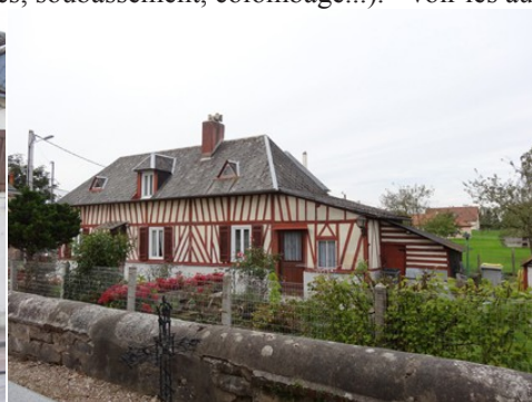
Une maison à pans de bois