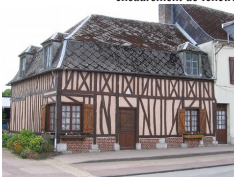
Quelques maisons de Bourneville

Les avis seront cohérents avec ceux émis ces dernières années, à savoir : pas de maisons à volume compliqué (type V, W, Y, ou Z), pentes à 45° pour les volumes principaux, ardoise ou tuile plate de teinte brun vieilli, à 20u/m 2 , avec un débord de toiture de 20cm, enduit de teinte beige clair avec modénatures (au choix : chaînages, encadrement de fenêtres, soubassement, colombage...). *Voir les autres fiches.