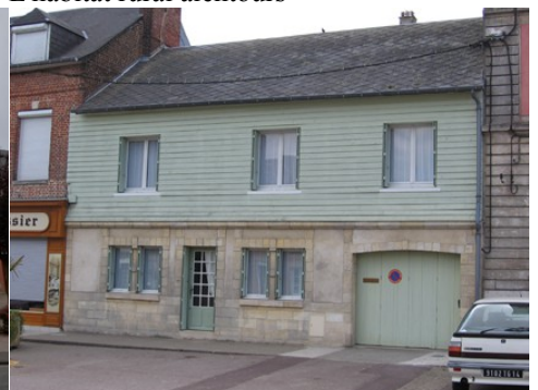
Une maison avec pierre et bardage