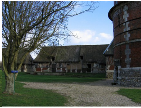
L'ancienne cour et ses dépendances