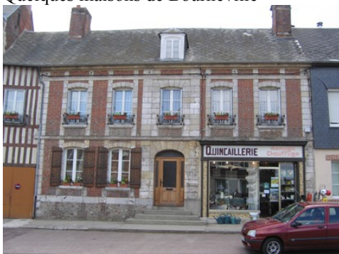
Un édifice mêlant brique et pierre