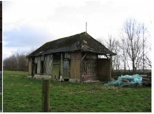
Une grange à pan de bois