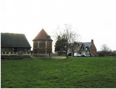
Le colombier et le corps de logis